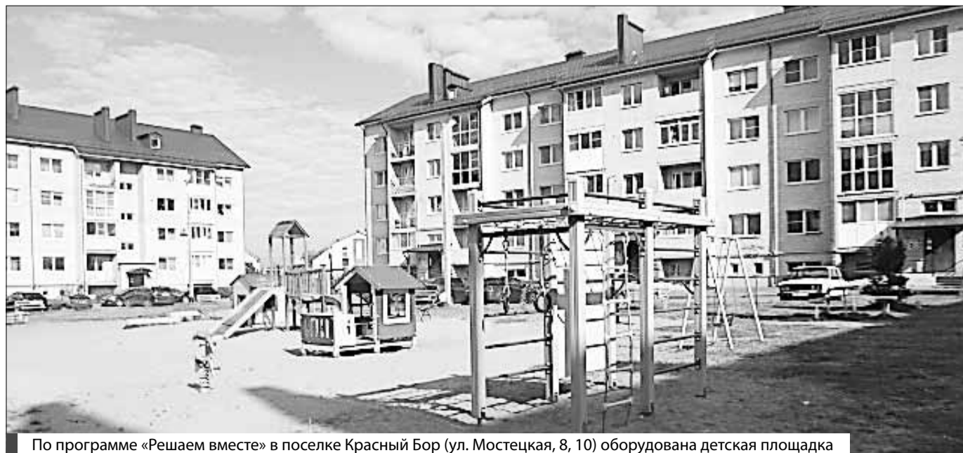
По программе «Решаем вместе» в поселке Красный Бор (ул. Мостецкая, 8, 10) оборудована детская площадка