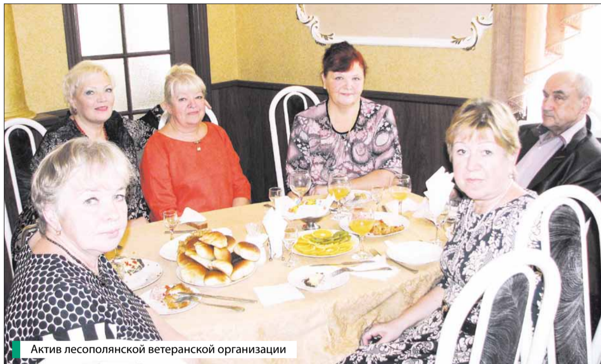
Актив леснополянской ветеранской организации