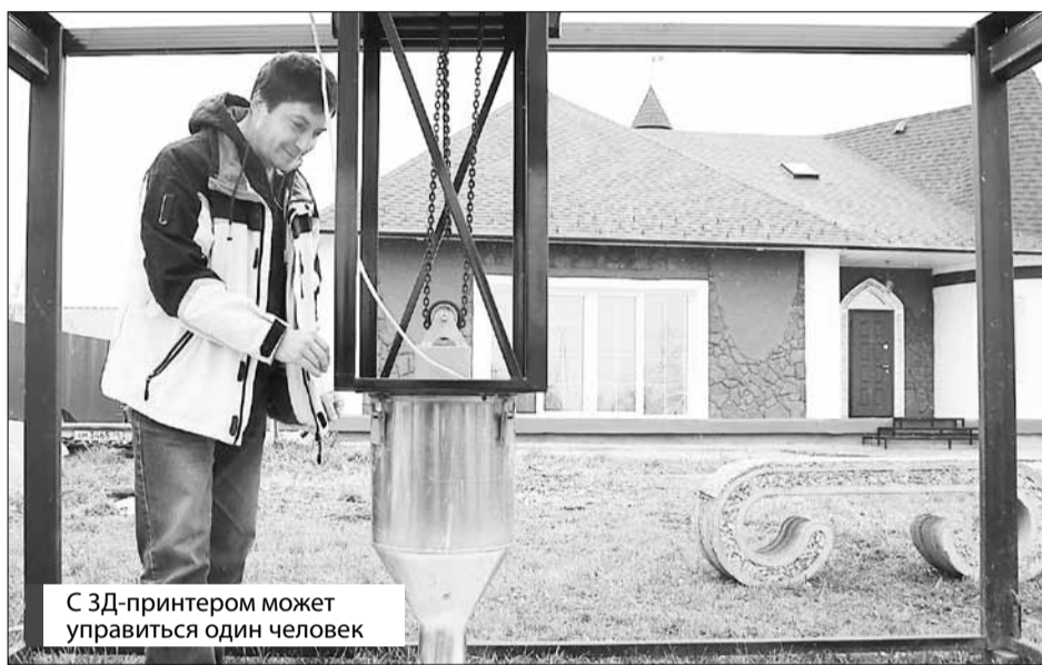
С 3D-принтером может управляться один человек

строительством. – Это самый первый дом в Европе, построенный по всем правилам жилищного строительства. Нам важно было создать прецедент, показать на практике, что строительная 3D-технология работает. На тот момент печатать дома было чем-то из области фантастики. Мы поставили задачу сделать это реальным. Перефразируя слова известной песни, взяли сказку сделать былью.