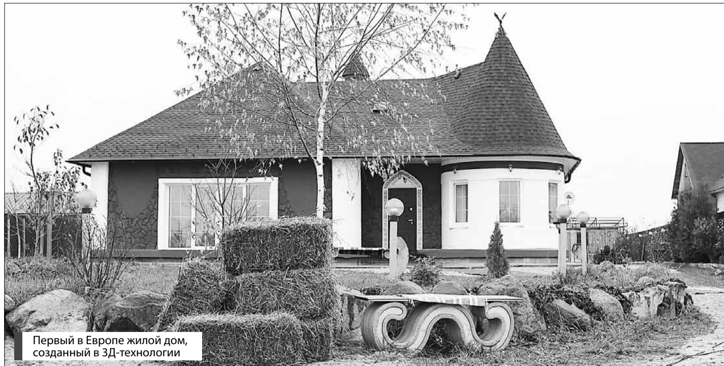
Первый в Европе жилой дом, созданный в 3D-технологии