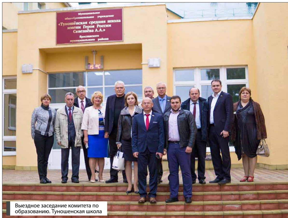
Выездное заседание комитета по образованию. Туношенская школа