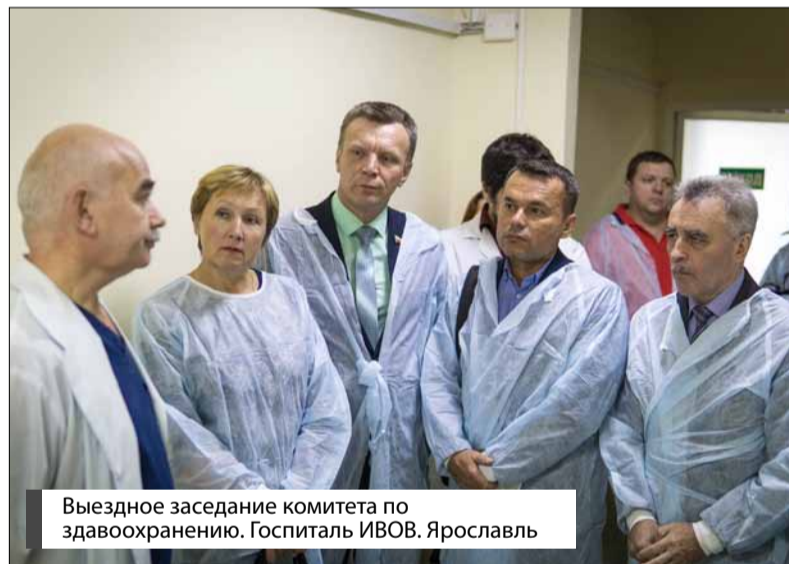
Выездное заседание комитета по здравоохранению. Госпиталь ИВОВ. Ярославль