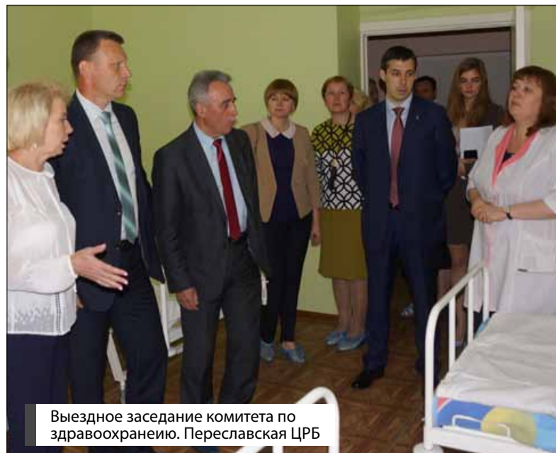
Выездное заседание комитета по здравоохранению. Переславская ЦРБ