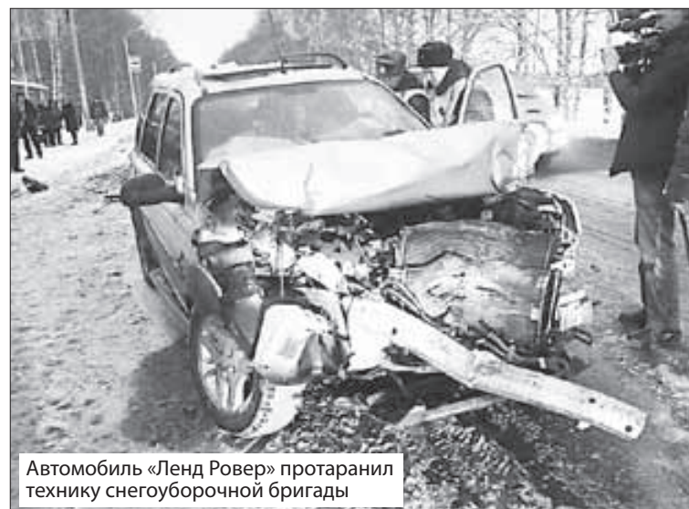
Автомобиль «Ленд Ровер» протаранил технику снегоуборочной бригады

16 ЯНВАРЯ около 15.35 в районе поселка Заволжье произошло дорожно-транспортное происшествие. Мужчина 1988 года рождения, управляя автомобилем «Нива Шевроле», совершил наезд на двоих пешеходов, находившихся на обочине автодороги. В результате ДТП женщина 1965 г.р. доставлена в больницу с переломом ноги и ушибами, а женщина 1948 г.р. отпущена домой после оказания медицинской помощи. Сотрудниками Госавтоинспекции проводится проверка, устанавливаются все обстоятельства произошедшего.