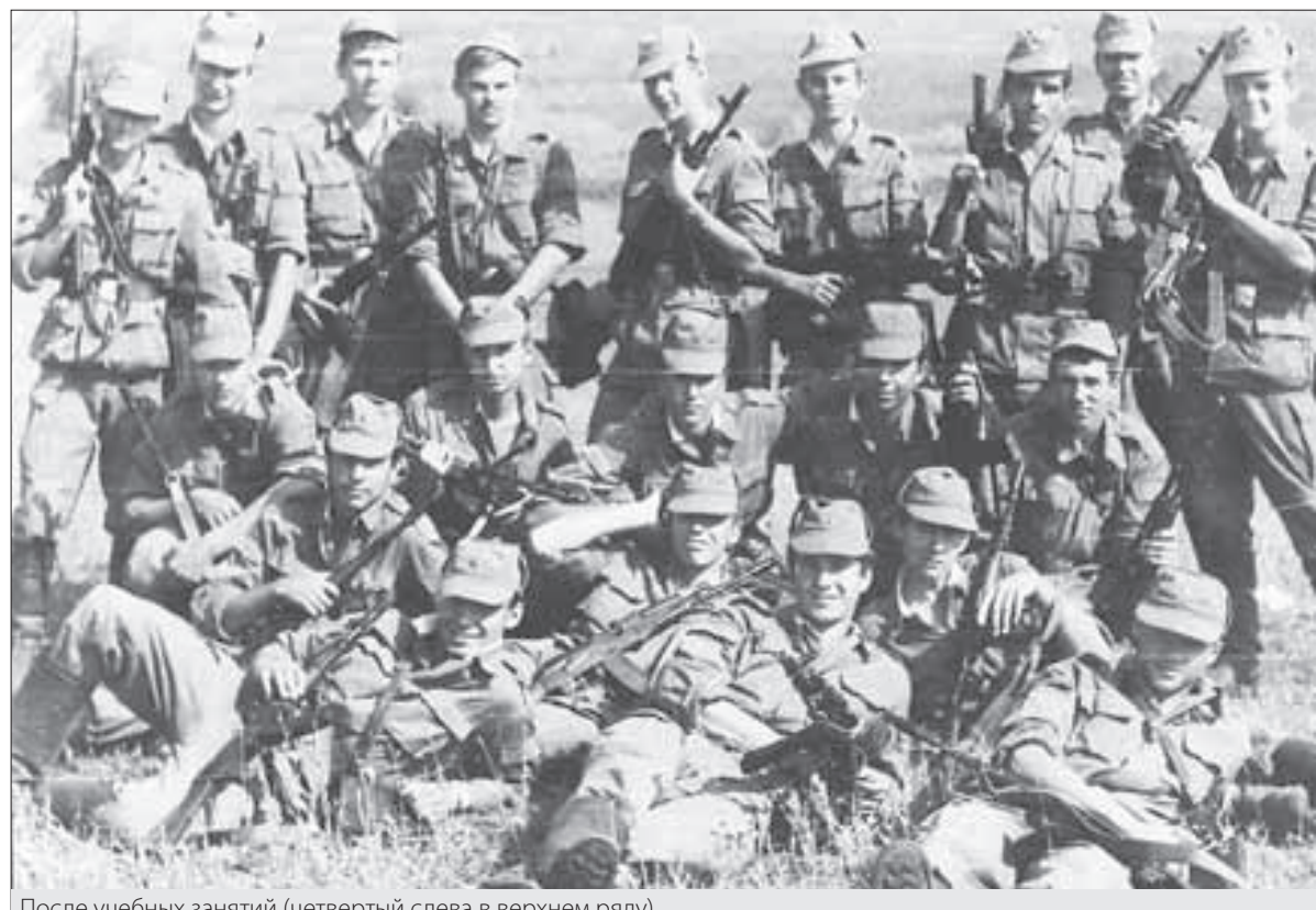
После учебных занятий (четвертый слева в верхнем ряду)