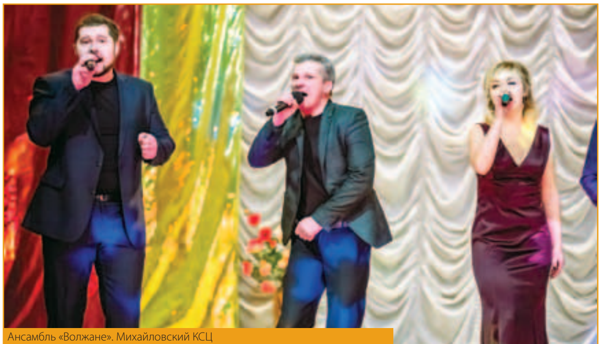
Ансамбль «Волжане». Михайловский КСЦ