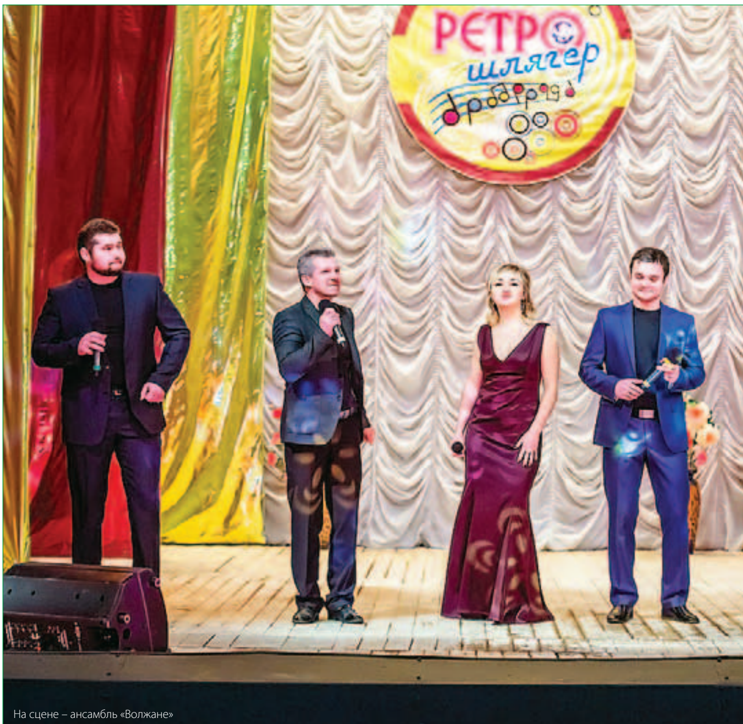
На сцене – ансамбль «Волжане»