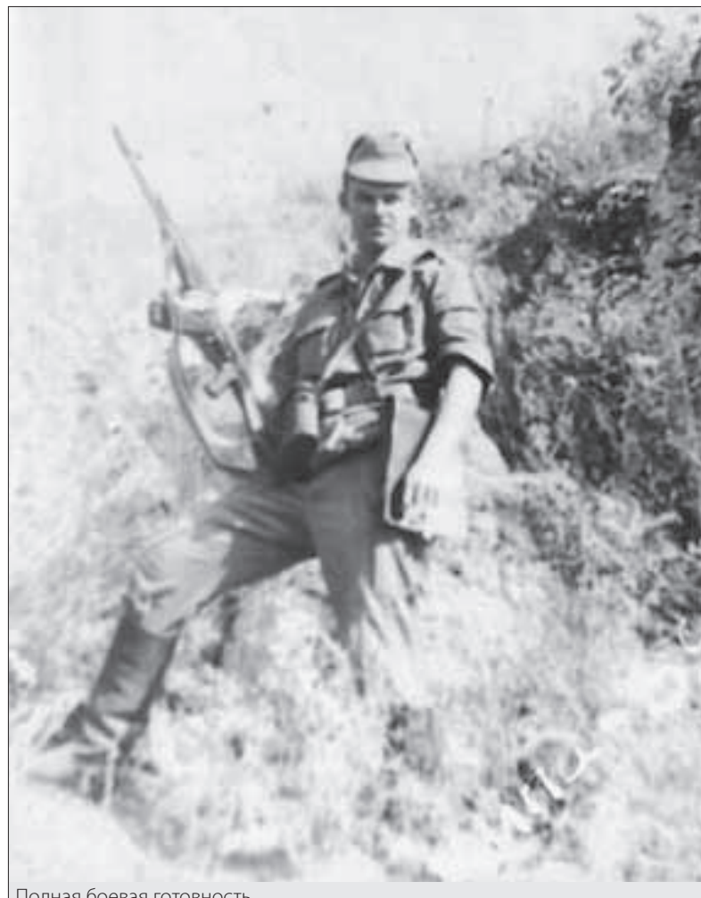
Полная боевая готовность