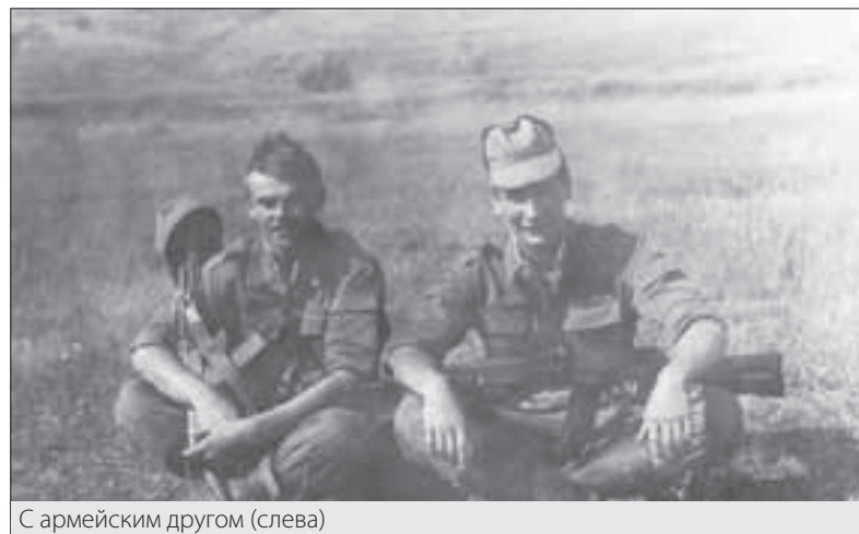
С армейским другом (слева)