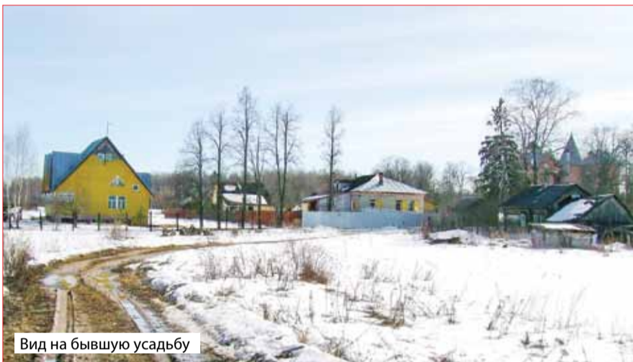
Вид на бывшую усадьбу

укрупнения волостей была упразднена Еремеевская волость, и село навсегда утратило статус административного центра. Еремеевское вошло в Ярославскую волость Ярославского уезда. В 1924 году в составе волости был образован Ананьинский сельсовет. В 1959 году Ананьинский и Телегинский сельсоветы объединили в Климовский с центром в деревне Климовское. Через четыре года Климовский сельсовет был переименован в Телегинский. Его центром стало село Крест, а затем, после включения этого села в состав города, – поселок Нагорный.