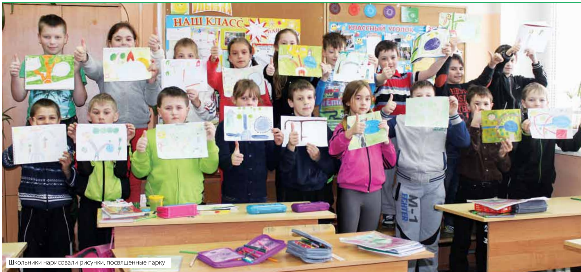
Школьники нарисовали рисунки, посвященные парку

В ПРОШЛОМ ГОДУ СТАРТОВАЛ ИНТЕРЕСНЫЙ ПРОЕКТ ПО СОЗДАНИЮ ПАРКА В СЕЛЕ ТУНОШНА. ЭТО СОВМЕСТНАЯ ИНИЦИАТИВА ГРУППЫ ДЕПУТАТОВ, АДМИНИСТРАЦИИ И ОБЩЕСТВЕННОСТИ.