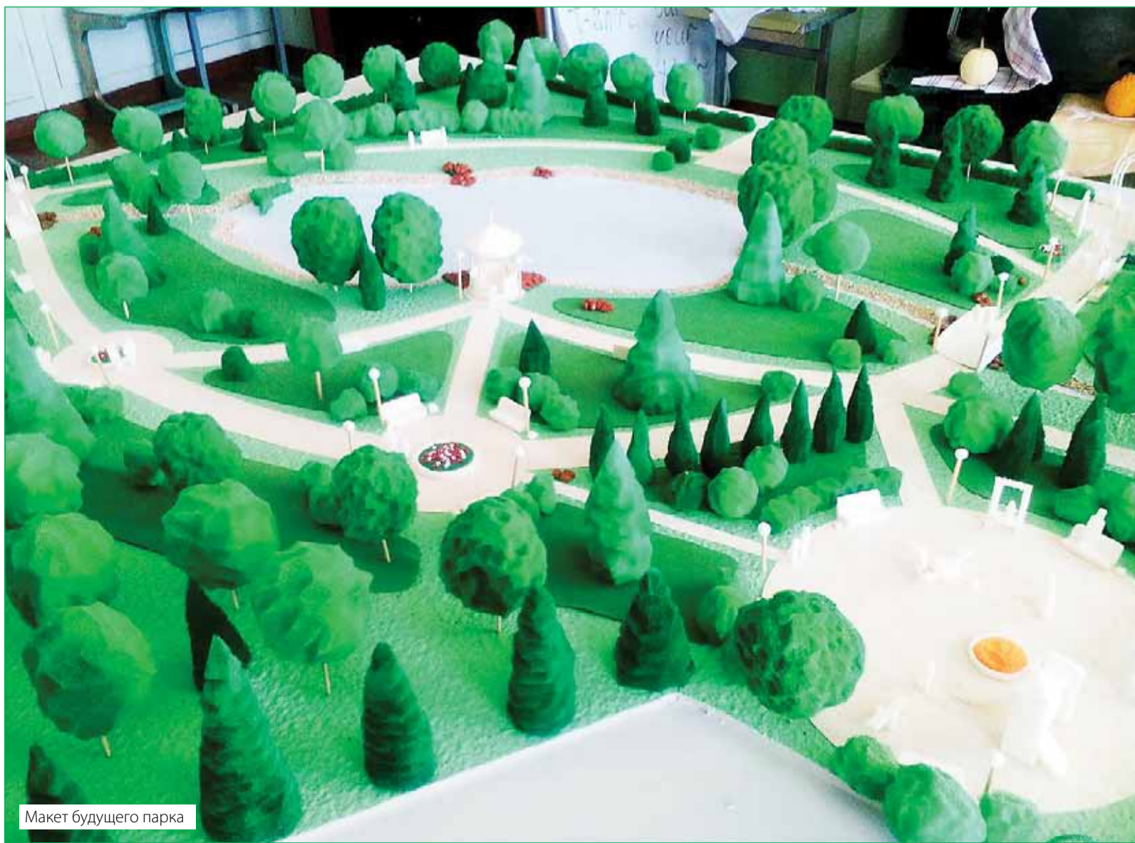
Макет будущего парка