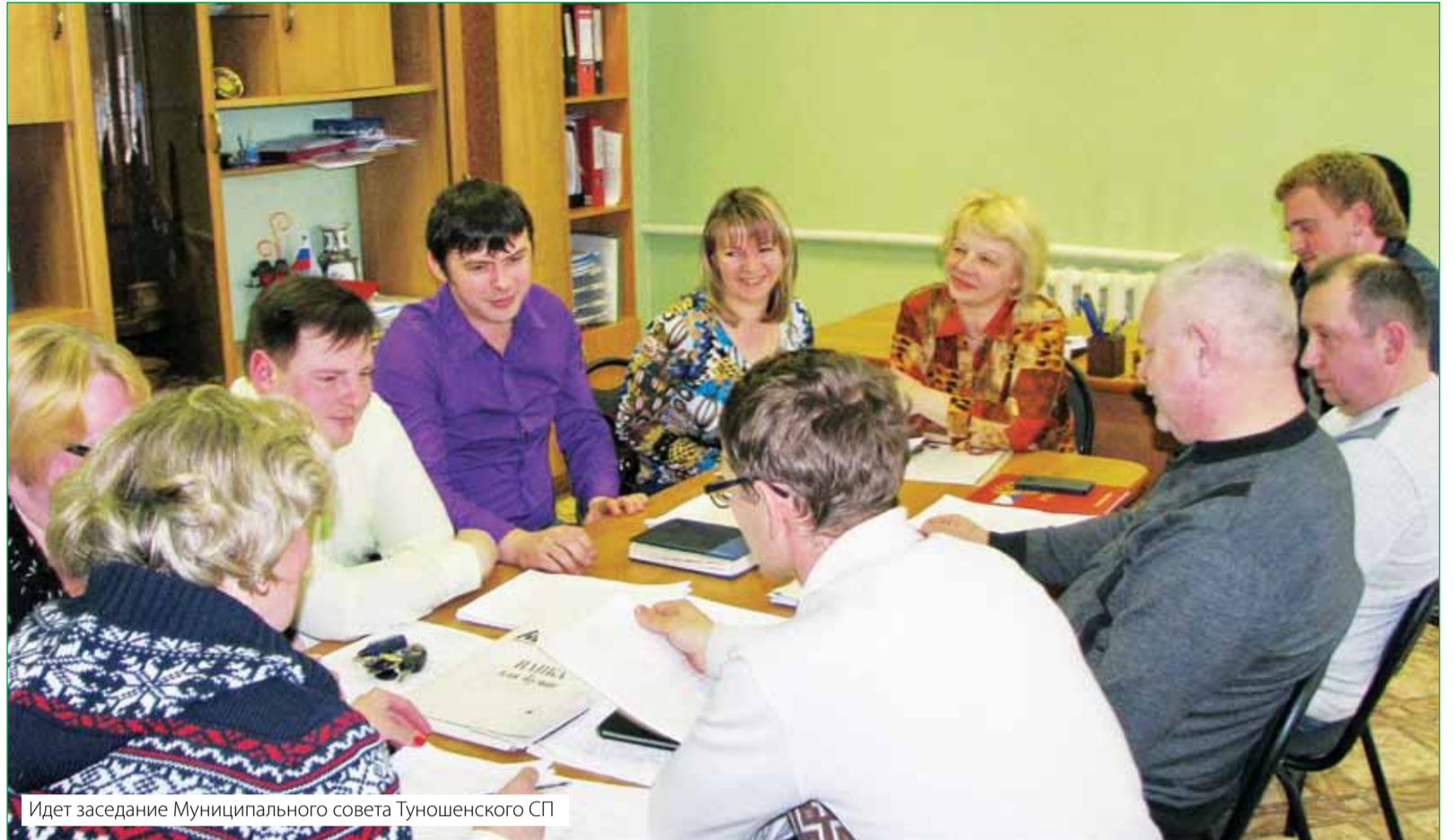
Идет заседание Муниципального совета Туношенского СП

Депутаты муниципальных советов поселений – это, как правило, наиболее активные представители своих территорий. В ходе заседаний они рассматривают важнейшие вопросы, касающиеся жизни поселений, и принимают по ним решения. Но одной работой с законодательными актами их деятельность не ограничивается. Депутаты участвуют в общественных мероприятиях, держат связь с избирателями, интересы которых они представляют, и по мере возможностей помогают решить накопившиеся проблемы.