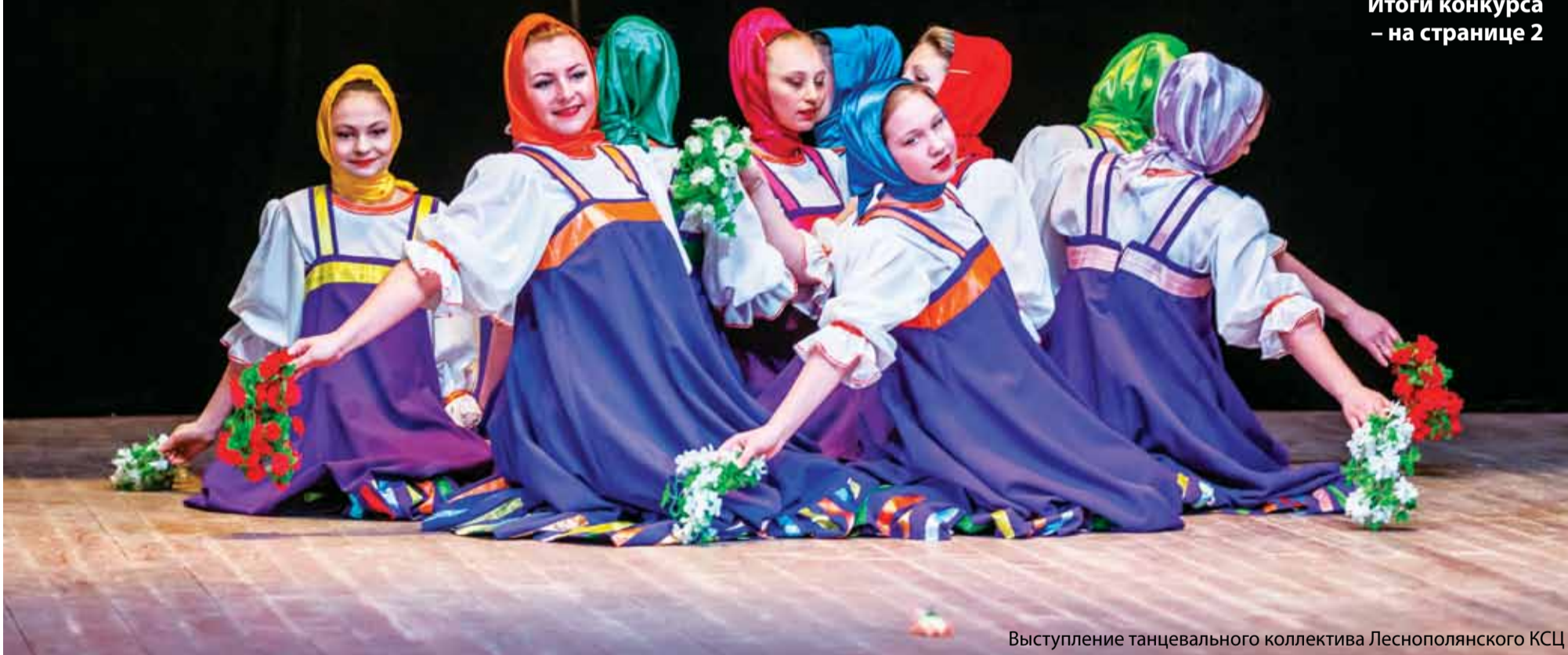
Выступление танцевального коллектива Леснополянского КСЦ