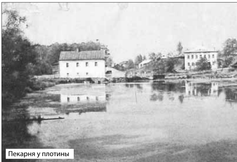
Пекарня у плотины