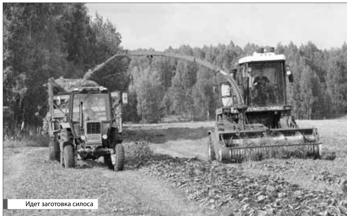
Идет заготовка силоса