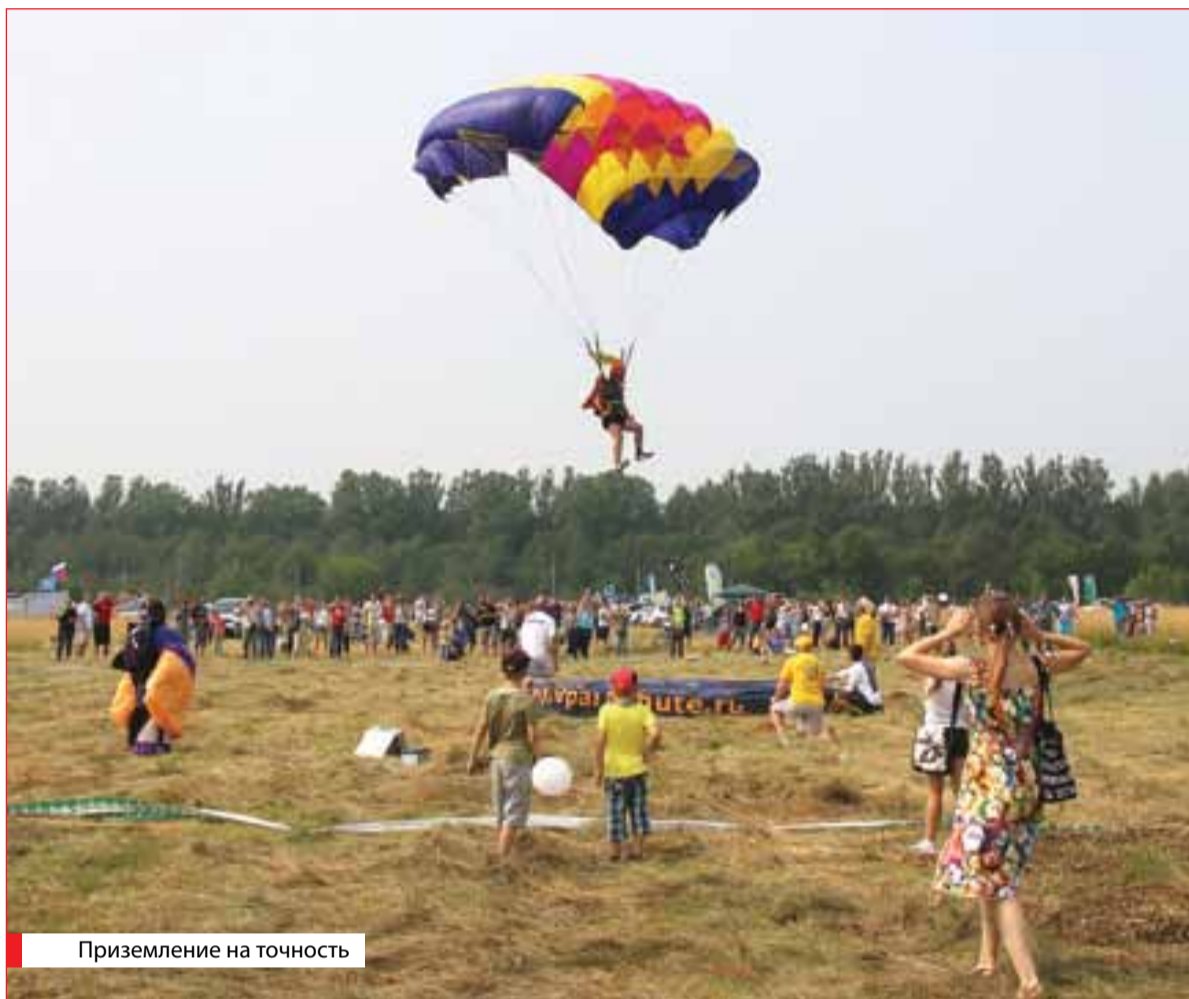
Приземление на точность

– Этот праздник позволяет нам отдыхать всей семьей, здесь каждому найдется дело по душе, – отметила глава Ярославского муници-