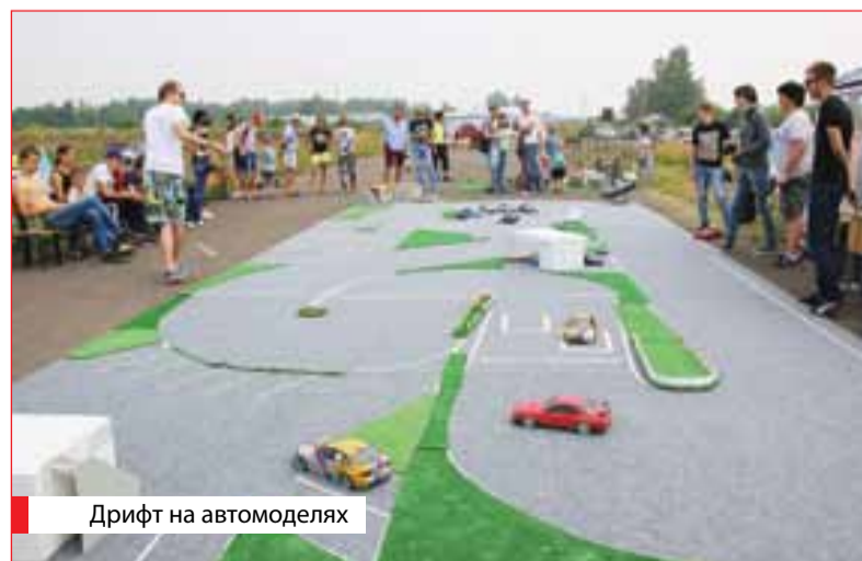
Дрифт на автомоделях