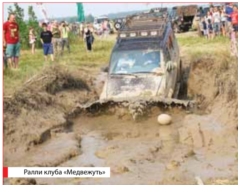
Ралли клуба «Медвежуть»

Поодаль расположились взлетно-посадочная полоса для авиамоделей и трасса для дрифта. Трасса небольшая, примерно три на пять метров. А дрифт – управляемый занос на максимальной скорости – показывали «лихачи» на радио-