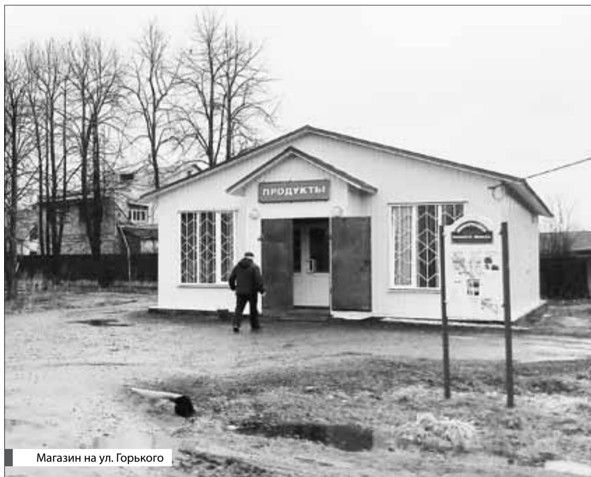
Магазин на ул. Горького