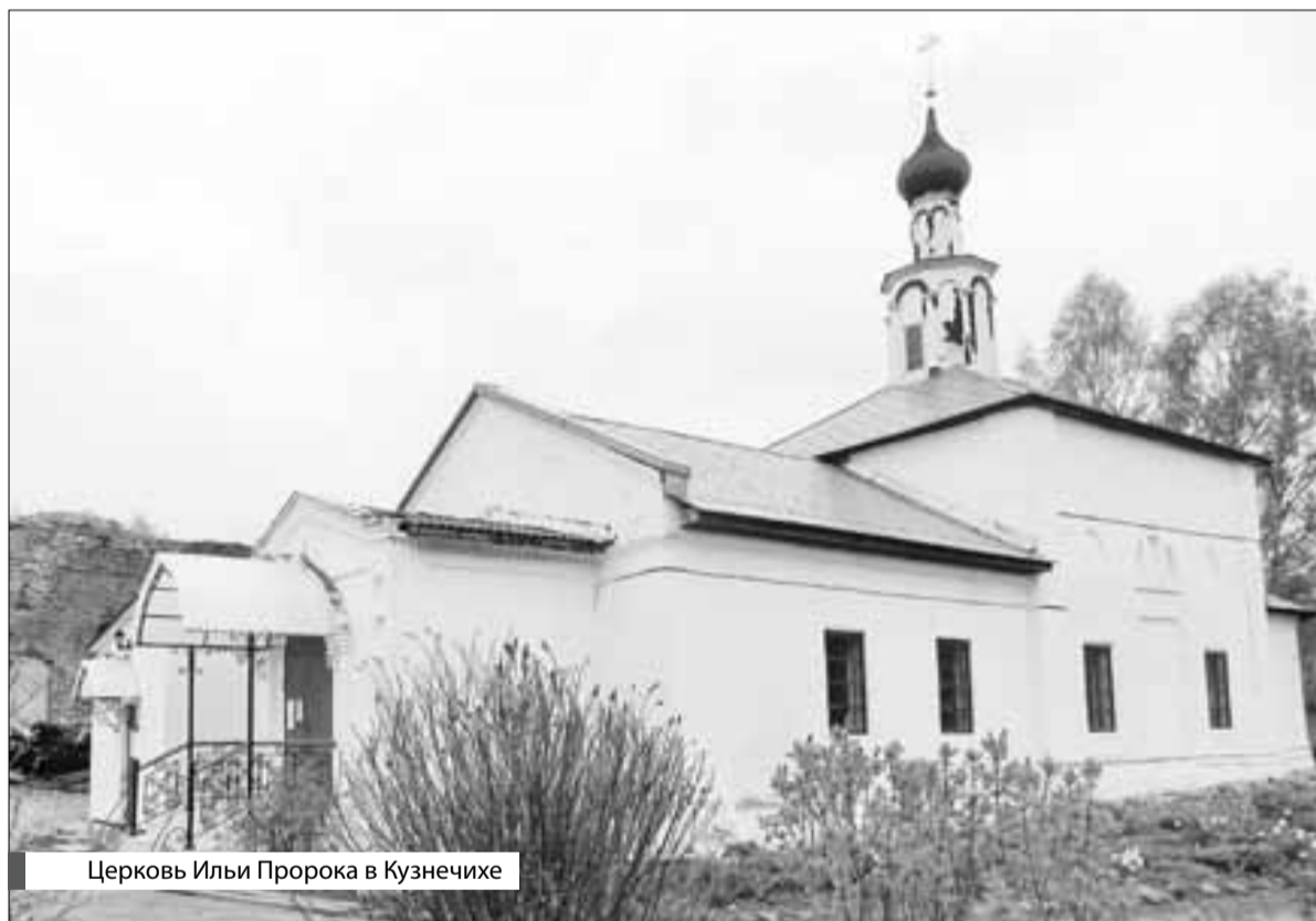
Церковь Ильи Пророка в Кузнечихе