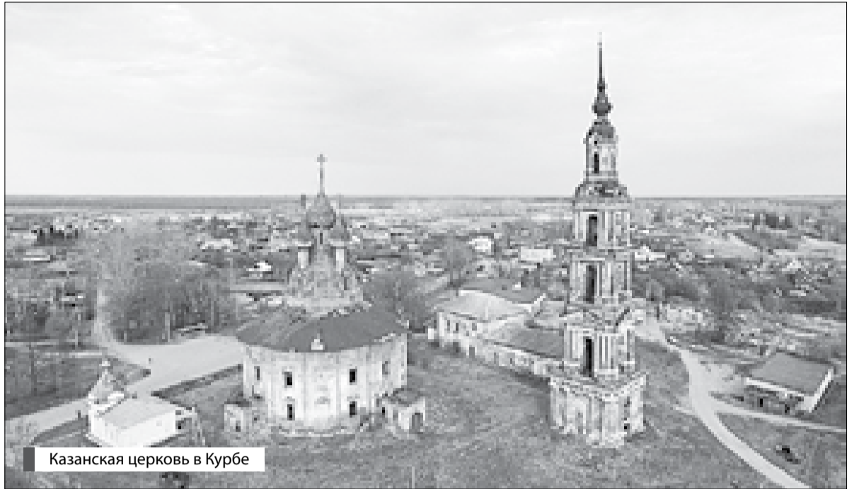
Казанская церковь в Курбе

Посвящение храмов и монастырей Казанскому образу Богородицы в нашей стране можно считать одним из самых популярных, не отстает в этом и наш Ярославский район. В нем насчитывается 6 подобных храмов и даже одна часовня, которая находится в деревне Орлово. Само ее существование можно считать настоящим чудом, потому что в советское время