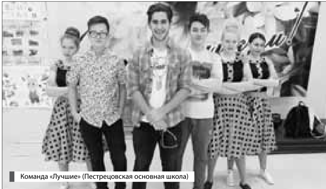
Команда «Лучшие» (Пестрецовская основная школа)

используют недопустимые методы обучения, сопряженные с применением физического насилия над детьми. Со слов родителей, руководство школы, зная о сложившейся ситуации, никаких мер не принимает. По сообщениям СМИ следственными органами Следственного комитета Российской Федерации по Ярославской области инициировано проведение доследственной проверки на предмет установления в бездействии администрации школы наличия или отсутствия признаков состава преступления, предусмотренного ст. 293 УК РФ (халатность). По результатам доследственной проверки будет принято процессуальное решение.