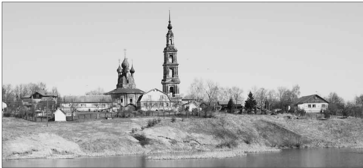
▲ Панорама села Курба