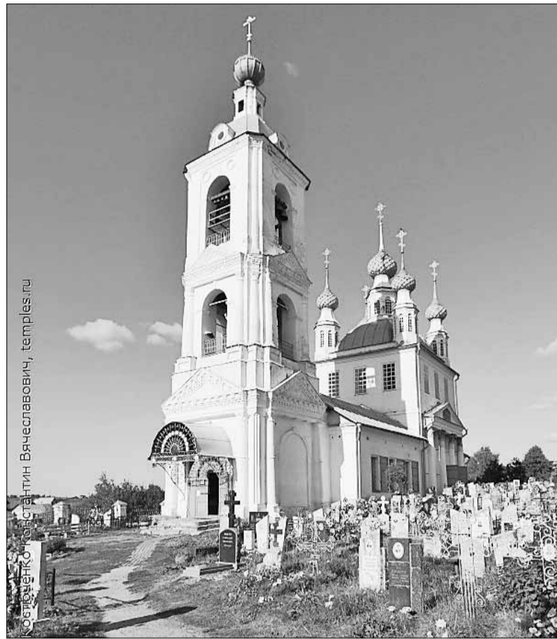
▲ Покровский храм в селе Толгобол