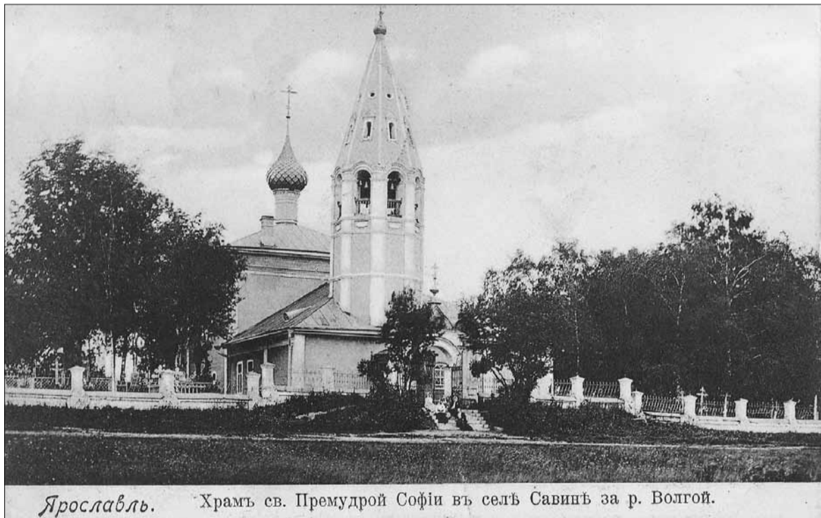
Ярославль. Храмъ св. Премудрой Софи въ селѣ Савинѣ за р. Волгой.