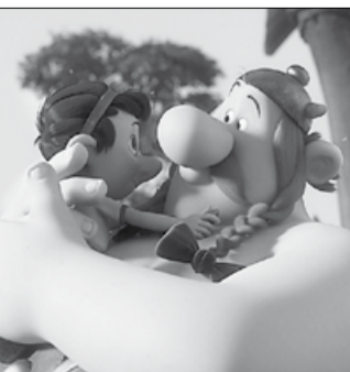
Франция, 2014, режиссеры Луис КЛИШИ, Александр АСТЬЕ

Астерикс и его лучший друг Обеликс продолжают свою многолетнюю борьбу с Цезарем, который хочет наконец-то расправиться с неукротимыми галлами. Вокруг деревни Астерикса Цезарь приказывает построить новый Рим — Землю Богов. В галльской деревне хаос и смятение. Но Астерикс и Обеликс не сдаются!