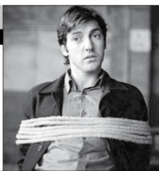
Франция, 2003, режиссер Жерар КРАВЧИК

Наглая банда Санта-Клаусов терроризирует Марсель в самый канун Рождества, обещая очистить город до основания. Комиссар полиции уже задумал провести крупномасштабную операцию под кодовым названием «Снеговик», в которой главная роль отведена таксисту Даниелю и отважному полицейскому Эмильену.