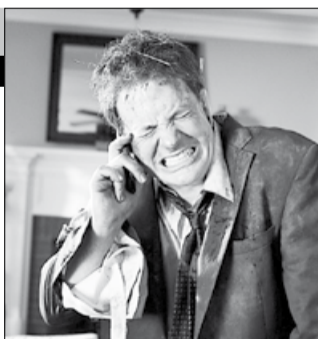
США, ОАЭ, 2010, режиссер Роджер КАМБЛ

Амбициозный бизнесмен Дэн Сандерс приступает к осуществлению грандиозного проекта: он хочет разбить город прямо посреди Орегонской пустыни. Покой и красота этих мест безжалостно нарушается шумом экскаваторов и грузовиков. Но не тут-то было! На защиту природы встают... звери — пушистые, зубастые и когтистые. Их месть не знает пощады!