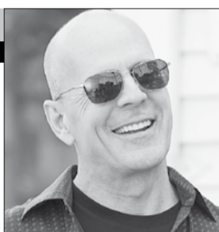
США, 2010, режиссер Кевин СМИТ

История двух давних напарников — нью-йоркских полицейских, занятых поисками очень редкой и чертовски дорогой бейсбольной карточки, украденной у одного из них. Они вынуждены противостоять беспощадному гангстеру, просто помешанному на коллекционных вещах. Теперь копам придется сразиться не просто за редкую вещь, а за свои судьбы.