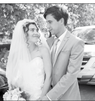
Россия, 2013, режиссер Жора КРЫЖОВНИКОВ

Прогрессивные Наташа и Рома мечтают о европейской свадьбе на берегу моря... но у Наташиного отчима заготовлен другой сценарий. Грубый чиновник городской администрации рассматривает торжество как трамплин для собственной карьеры и стремится устроить все «как надо». Молодых ждет незабываемая церемония по всем канонам.