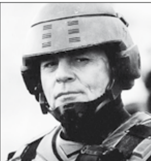
США, 1997, режиссер Пол ВЕРХОВЕН

В новом тысячелетии над человечеством нависла смертельная опасность. Несметные полчища гигантских разумных жуков с далекой системы планет Клендату угрожают всему живому во Вселенной. Солдат элитного подразделения Джонни Рико и пилот Кармен в составе звездного десанта землян отправляются в зловещие глубины космоса.