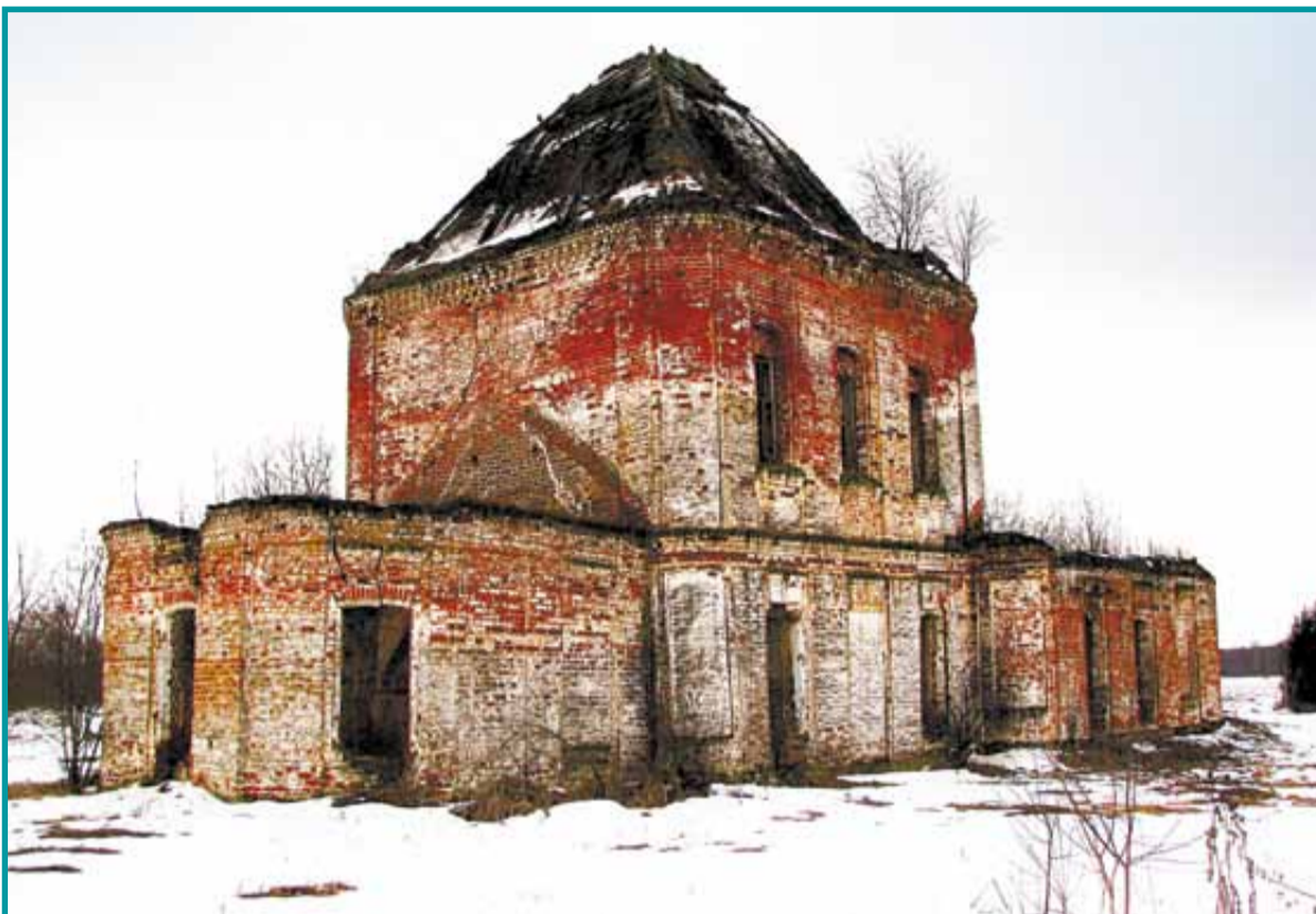
◀ Церковно-приходская школа

Раменье входило в Романово-Борисоглебский уезд. В «Кратких сведениях о монастырях и церквах Ярославской епархии» (1908 год) говорится: «Церковь прочная... Дома у священника и псаломщика церковные, деревянные, для жительства удобные... Село стоит на равнине, построено на два посада, между посадами ров, который весной заполняется водой, по сто-