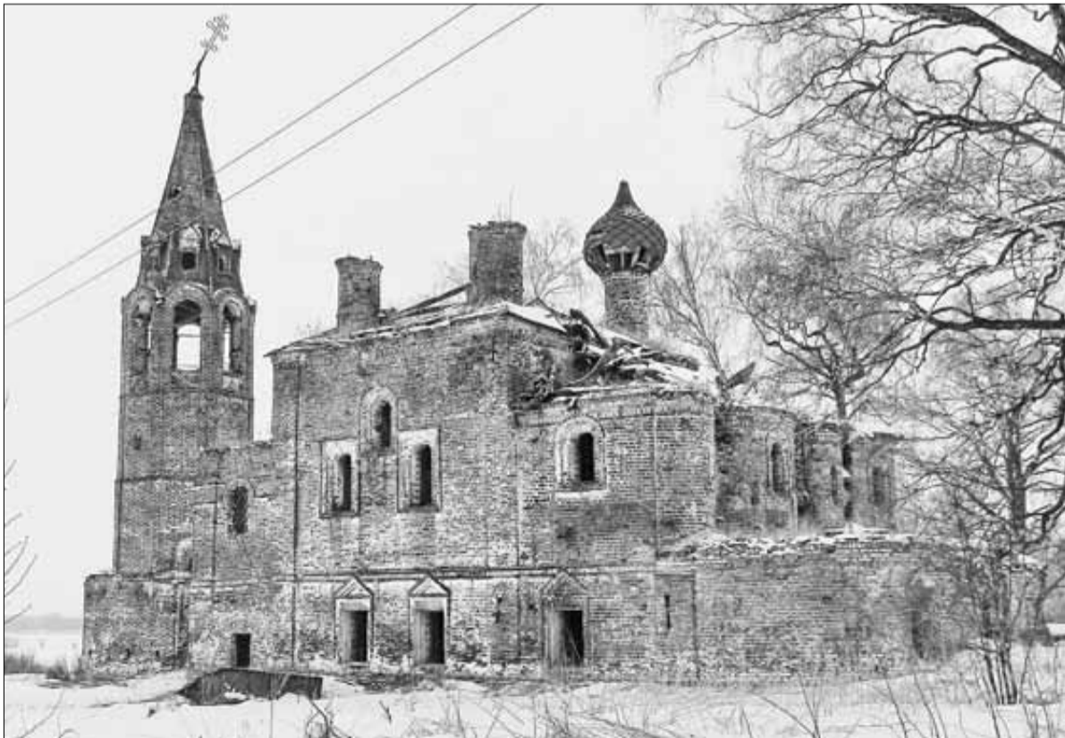
▼ Древний храм в Аристове разрушается на глазах

В Ярославском районе насчитывается 200 объектов культурного наследия – это памятники архитектуры, археологии, истории, садово-паркового искусства. Они имеют федеральное и региональное значение, но подавляющее большинство – выявленные объекты, которые также подлежат государственной охране до принятия решения о включении в реестр либо об отказе во включении в реестр.