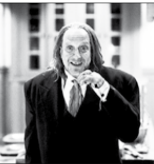
США, Канада, 2001, режиссер Кинен Айвори УАЙАНС

Отыгравшись по полной программе в фильме «Очень страшное кино» на молодежных ужастиках, создатели картины окончательно потеряли стыд и совесть! Теперь пришла очередь киноклассики «Изгоняющий дьявола», «Полтергейст», «Кладбище домашних животных» и таких блокбастеров, как: «Ангелы Чарли», «Миссия невыполнима-2» и «Ганнибал».