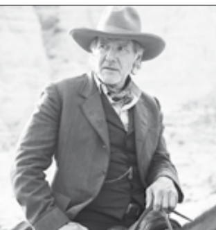
США, 2011, режиссер Джон ФАВРО