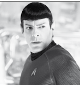
США, 2013 режиссер Джей Джей АБРАМС

Вернувшись на Землю, команда корабля «Энтерпрайз» обнаруживает, что деятельность и принципы их организации подорваны изнутри. Флот скван необъяснимым ужасом и бездействует, пока мир все глубже погружается в бездну. Капитан Кирк берет на себя руководство операцией по поимке злодея, ответственного за этот хаос.