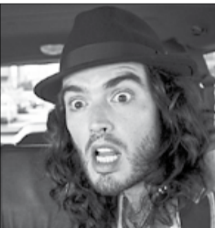
США, 2010, режиссер Николас СТОЛЛЕР

Арон Гринберг получил работу, о которой мечтал всю жизнь. Но он никак не ожидал, что его первым заданием будет привезти из Лондона в Лос-Анджелес строптивую рок-звезду. Альдус Сноу — бывший кумир миллионов, знаменитый рокер и прекрасный музыкант, который после продолжительного пике собирается вернуться на большую сцену.