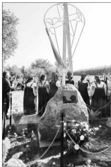
▲ Мемориал в честь подвига Амет-Хана Султана

В мирное время Амет-Хан Султан стал летчиком-испытателем Летно-исследовательского института в городе Жуковском Московской области. Находился на острие испытания новейшей техники, освоил около ста типов летательных аппаратов. В 1961 году ему было присвоено звание «Заслуженный летчик-испытатель СССР». Погиб 1 февраля 1971 года при выполнении испытательного полета.