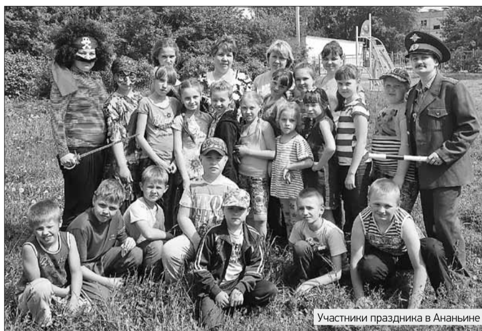
Участники праздника в Ананьино