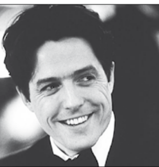
Великобритания, США, 1999, режиссер Келли МАКИН

Добропорядочный Микки Фелгейт влюбился в дочь нью-йоркского гангстера Джину Витале. Но узнает об этом, когда речь уже зашла о свадьбе. Эта новость не сильно смутила Микки, да и Фрэнк Витале оказался милейшим человеком и встретил будущего зятя с распростертыми объятиями. Микки, можно сказать, оказался в эпицентре событий незаконного свойства.