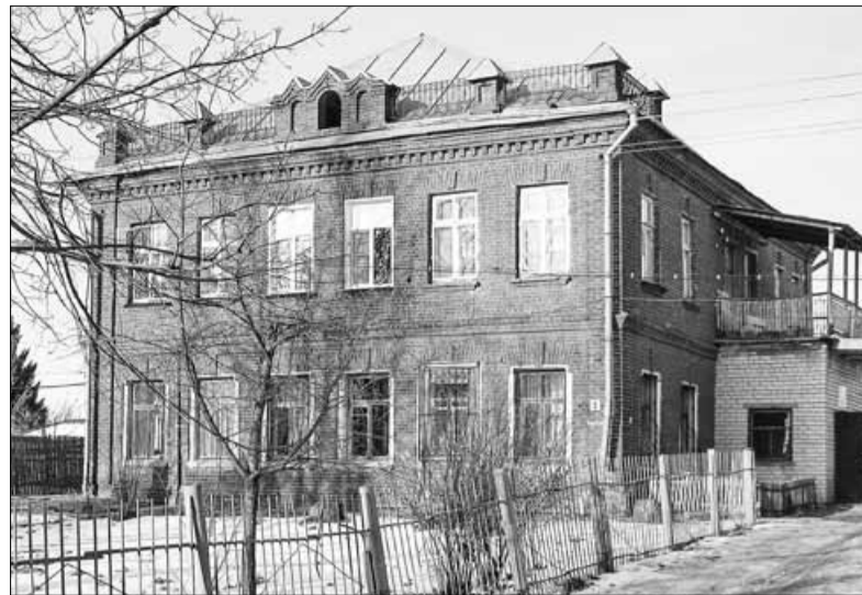
▲ Кое-где видны старинные каменные дома

Потомки воеводы Богдана Камынина оставались владельцами части Курьской волости еще в конце XIX столетия. Другая половина Курбы во второй половине XVII – начале XVIII века принадлежала дьяку Степану Кудрявцеву и его наследникам. В 1722 году эту часть Курбы приобрел капитан первого ранга, известный кораблестроитель времен Петра I Гаврила Авдеевич Меншиков (1672–1742). Как и его знаменитый однофамилец, Меншиков был выходцем из низов. Сын придворного конюха, он еще