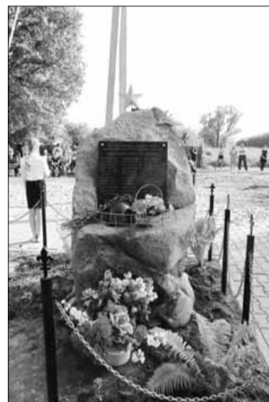
▲ Памятный знак землякам – участникам Великой Отечественной войны

– Это дань памяти нашему герою, а он наш герой. Наши герои защищали нашу землю, невзирая на социальные статусы и место, где они родились. В едином подвиге наши отцы и деды защитили родную землю, – отметил заместитель губернатора Ярославской области Юрий Бойко.