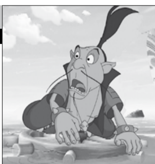
Россия, 2007, режиссер Владимир ТОРОПЧИН

Славится земля русская богатырями богатырскими да разбойниками разбойничьими... А сверху всего князь сидит, за всем следит. Да только не всегда выходит у князя так, как нужно — правильно. Вот и сейчас — с богатырём поругался да от Соловья-разбойника урон потерпел немалый: увёл бандит окаянный казну государственную прямо из-под носа!