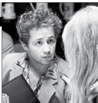
США, 2011, режиссер Рамаа МОЗЛИ

Признайтесь, каждому бы хотелось иметь волшебный чайник под кроватью, который выдает по первому требованию наличные?! Но кто знает, через что должен пройти миллионер? Богатые тоже плачут, ведь чайник производит деньги как только кто-то из окружающих чувствует боль. Как далеко готовы зайти ради денег молодожены Джон и Эллис в погоне за богатством?