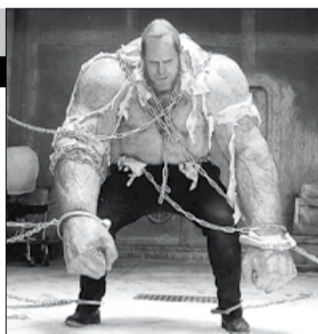
США, Германия, Чехия, Великобритания, 2003, режиссер Стивен НОРРИНГТОН