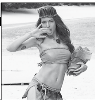
Россия, 2013, режиссер Кирилл КОЗЛОВ

Тихоокеанский лайнер. Полуобнаженные красотки, участвующие в конкурсе красоты. Шампанское и голубой океан... О таком бывшая звезда телевидения, а ныне ведущий дешёвых свадеб, даже и не мечтал. Однако круиз мечты неожиданно прервётся цепью невероятных событий. И наш герой окажется на необитаемом острове, в окружении трёх финалисток конкурса.