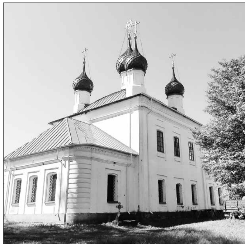
◀ Спасская церковь ▼ Восточные ворота