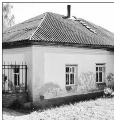
▲ Сторожка. ▲ Святые западные ворота ▼ Вид на Васильевский погост

Н. С. БОРИСОВ. «Окрестности Ярославля» (Москва, 1984, 2007)