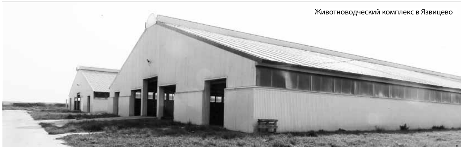
Животноводческий комплекс в Язвицево