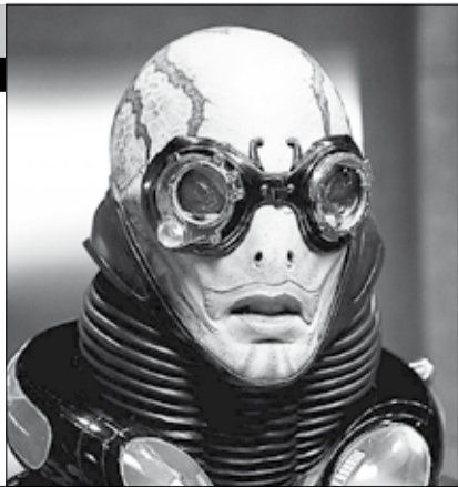
США, Германия, 2008

После того как древнее перемирие между человечеством и тайным миром было нарушено, на Земле вот-вот развернется ад. Безжалостный лидер, вхожий в оба мира, бросает вызов своей крови и пробуждает на свет неодолимую армию чудовищ. Настало время самому Хэллбою сразиться с беспощадным диктатором и его воинами. Вместе со своей пополняющей ряды командой «Бюро паранормальных исследований и развития» он будет бороздить границы двух миров.