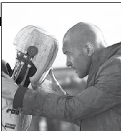
Болгария, США, Испания, Канада, 2014