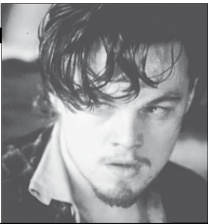
США, Германия, Великобритания, Нидерланды, Италия, 2002

Нью-Йорк, 1863 год. В диких трущобах города «американской мечты» действует только один закон — закон силы. Здесь идет в ход любое оружие, никто не считает потерь и не оплакивает погибших. В одной из жестоких стычек от рук вожака «коренных американцев» — Мясника Билла погибает предводитель банды «кирландцев» Вэллон. Его сын Амстердам надолго попадает в исправительную школу, затем ненависть на Мясника, ставшего хозяином окрестных кварталов.