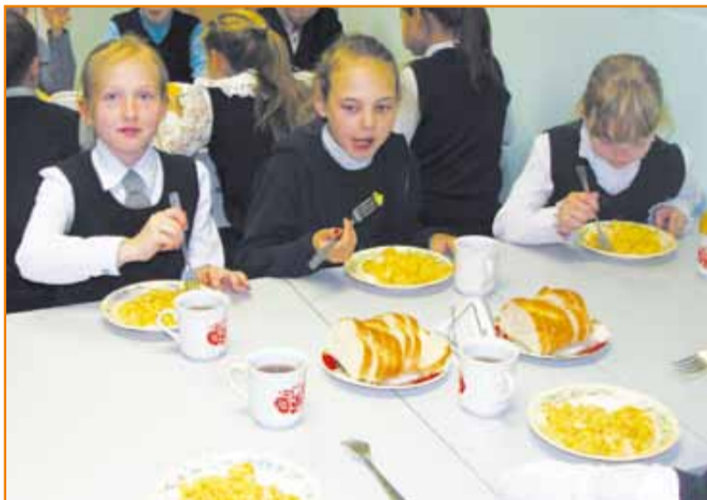
▲ В столовой ▼ На кухне ► Занятия ритмикой