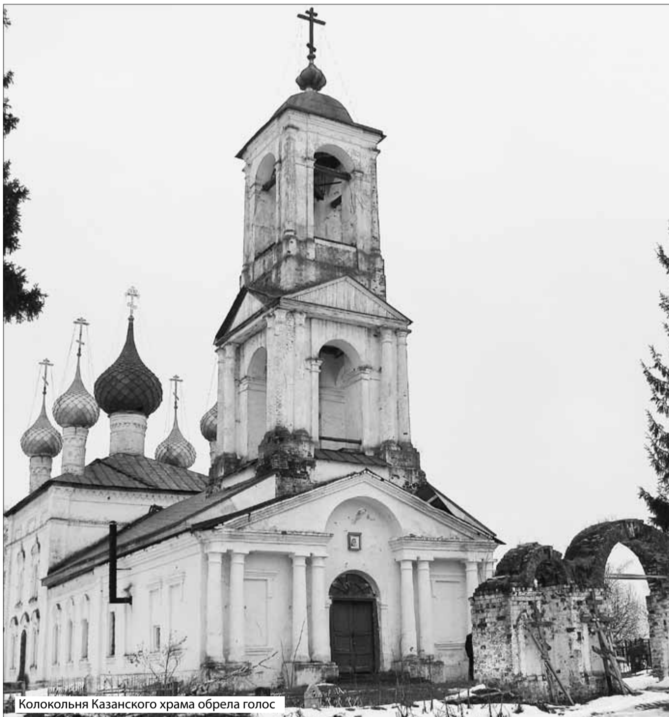
Колокольня Казанского храма обрела голос