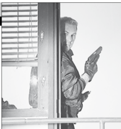
США, Россия, 2013

Рядовой аналитик ЦРУ Джек Райан приезжает в Москву, чтобы решить простую задачу: ему нужно проверить операции компании, принадлежащей миллиардеру Виктору Черевину. Но все усложняется, когда Райана пытаются убить. Теперь он вынужден защищаться с оружием в руках, вспоминая армейские навыки и неожиданно для себя оказываясь в роли настоящего спецопера. На помощь Джеку приходят маститый офицер спецслужб Харпер и супруга Кэти.