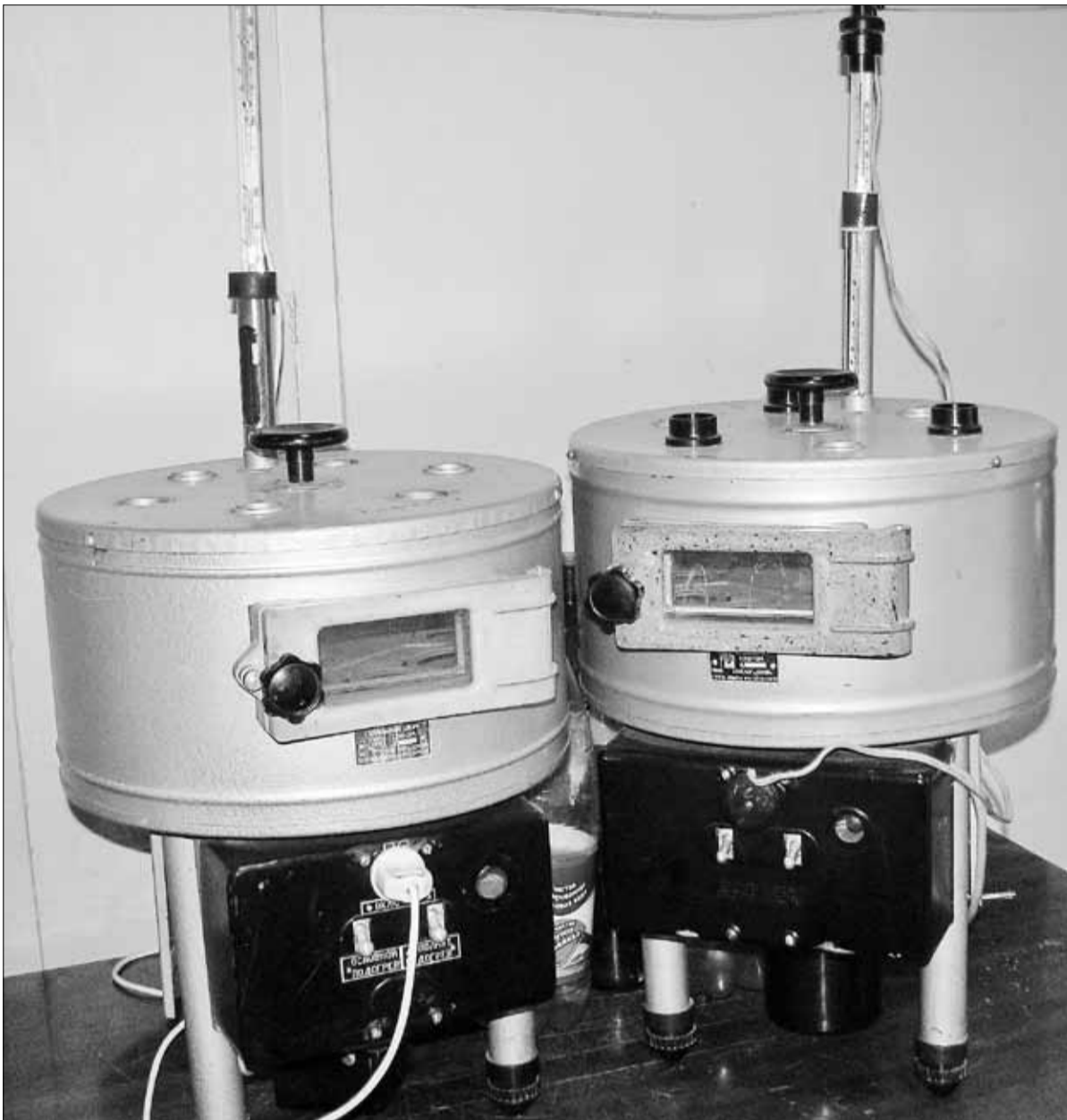
▼ Сушильные шкафы