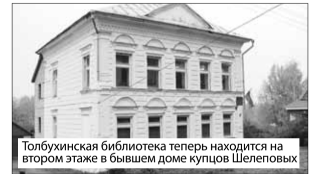
Толбухинская библиотека теперь находится на втором этаже в бывшем доме купцов Шелеповых