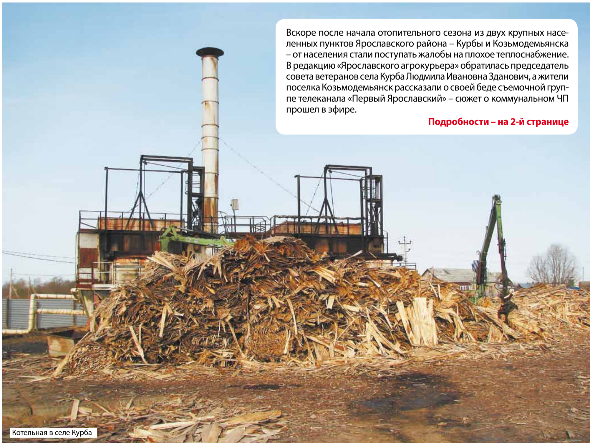
Котельная в селе Курба