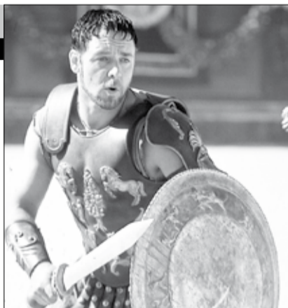
США, Великобритания, 2000

В великой Римской империи не было военачальника, равного генералу Максиму. Непобедимые легионы, которыми командовал этот благородный воин, боготворили его и могли последовать за ним даже в ад. Но случилось так, что отважный Максимум, готовый сразиться с любым противником в честном бою, оказался бессильным против вероломных придворных интриг. Генерала предали и приговорили к смерти. Чудом избежав гибели, Максимум становится гладиатором.