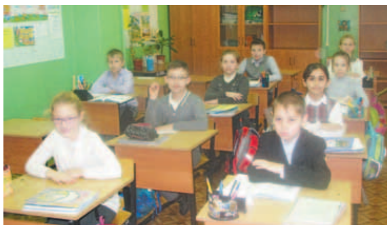
▲ Среди учеников 4-в класса много победителей и призеров различных конкурсов

В 1955 году здесь насчитывалось 1400 учащихся, которые учились в три смены. Школе требовалось новое здание, и тогдашний дирек-