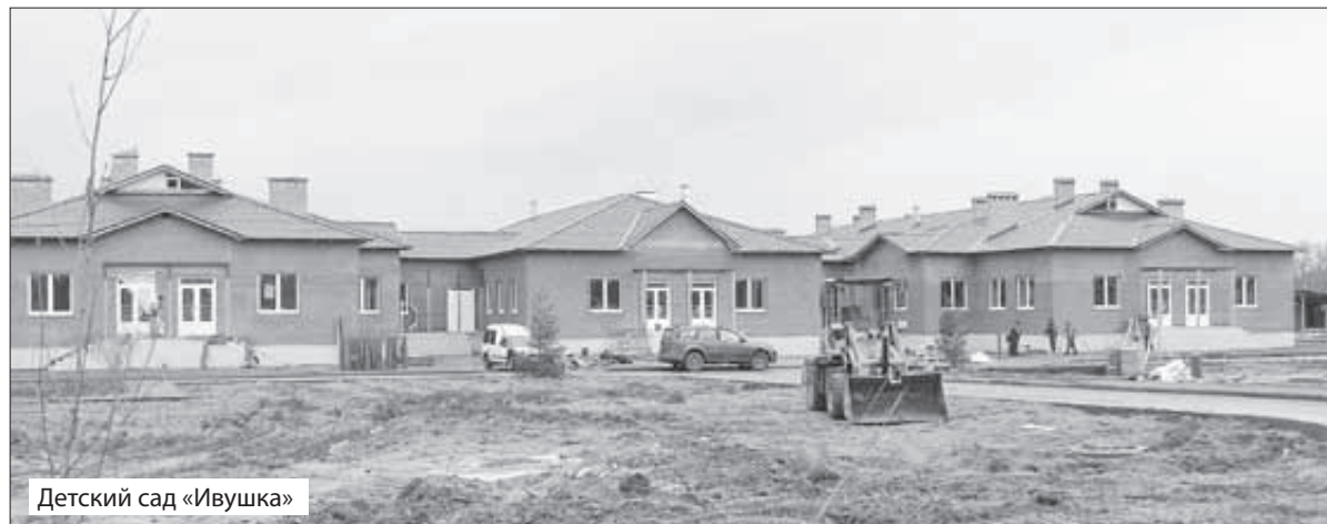
Детский сад «Ивушка»