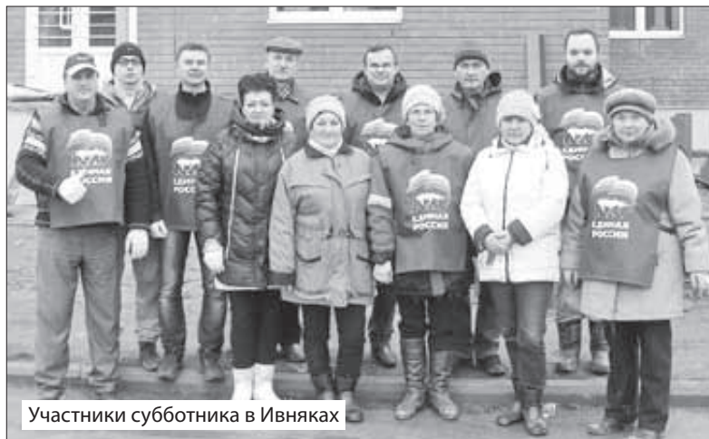
Участники субботника в Ивняках

В детском саду поселка Ивняки сейчас идет внутренняя отделка помещений и, пока позволяет погода, благоустройство прилегающей территории. Помещения обогреваются – отопление включено. Все работы держат на контроле правительство Ярославской области и администрация Ярославского муниципального района. Уже создано и зарегистрировано юридическое лицо – муниципальное дошкольное образовательное учреждение «Детский сад № 3