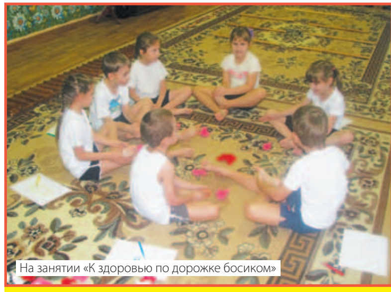
На занятии «К здоровью по дорожке босиком»

Дошкольное образовательное учреждение открыто внешнему миру, педагоги готовы перенимать опыт других и делиться своим опытом с коллегами и родителями, оказывать психолого-педагогическую поддержку всем семьям, имеющим детей дошкольного возраста, независимо от того, посещает ли ребенок детский сад, открыто обсуждают профессиональные проблемы и оказывают поддержку и помощь в их решении.