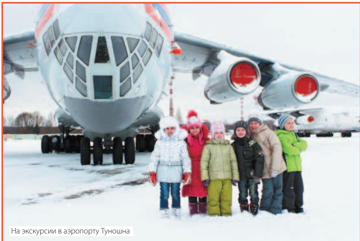
На экскурсии в аэропорту Туношна