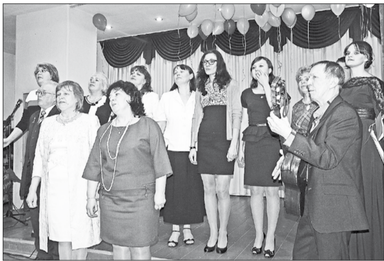
▲ Коллектив учителей ▼ Выпускники 1984 года