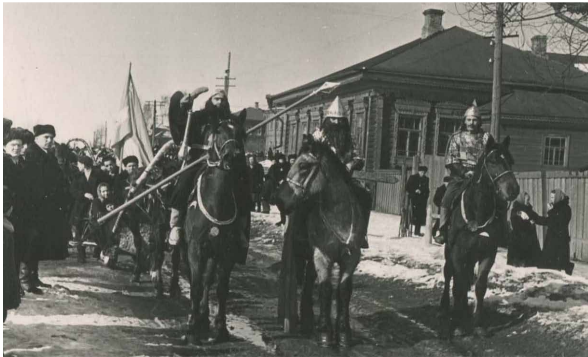
▲ Проводы русской зимы в Курбе