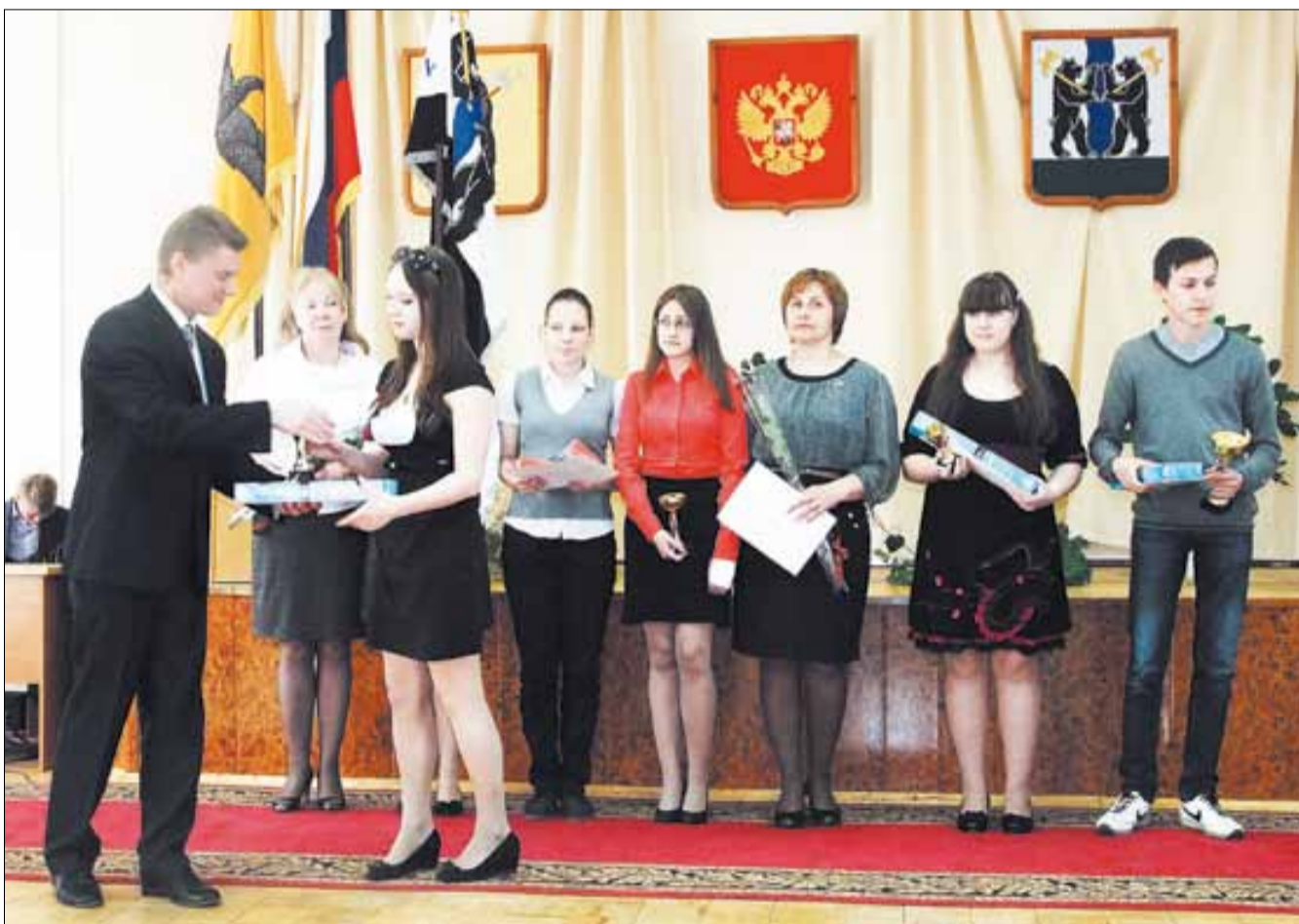
▲ Награждение обучающихся Красноткацкой СОШ

16 мая в администрации Ярославского муниципального района состоялся районный праздник «Олимп», посвященный чествованию победителей и призеров районного и областного этапов всероссийской олимпиады школьников, областных и всероссийских научно-практических конференций, областных и всероссийских спортивных соревнований 2013–2014 учебного года.