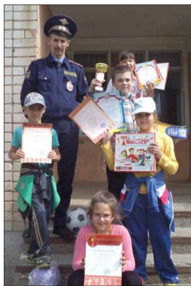
▲ БД 2014 Финалисты

Данный конкурс является лично-командным первенством среди обучающихся, воспитанников общеобразовательных учреждений района, в возрасте 9-11 лет и проводится в целях воспитания законопослушных участников дорожного движения. Учащиеся продемонстрировали свои знания в фигурном вождении велосипеда, знании Правил дорожного движения и основ оказания первой доврачебной помощи.