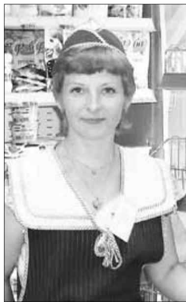
▲ Анна Гузеева