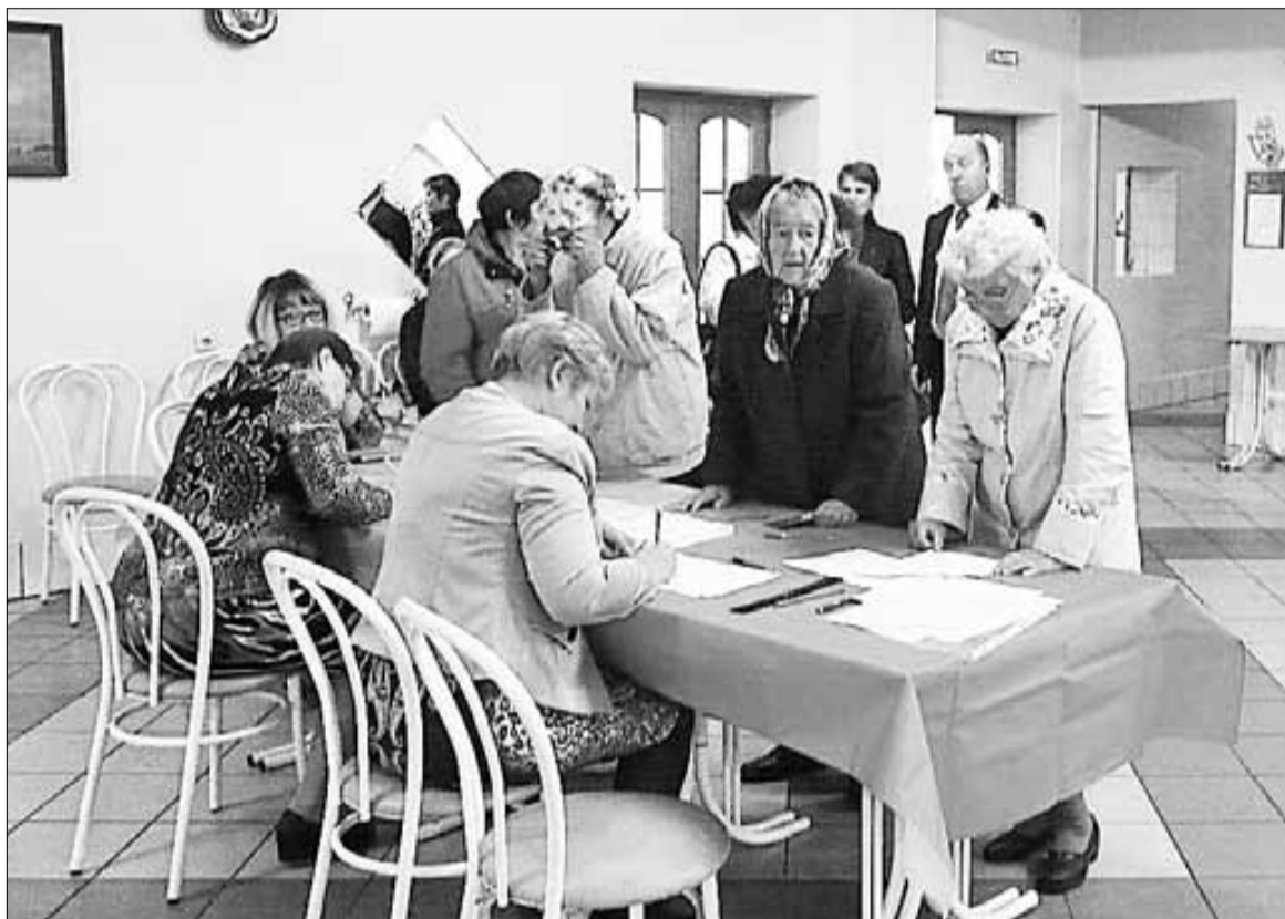
▲ Предварительное голосование в Андрониках

4-мандатный избирательный округ № 3 (Карабихское СП: Телегинский сельский округ и участки с центрами в п. Дубки и д.