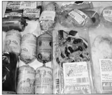
Залежалую еду убрала с прилавков