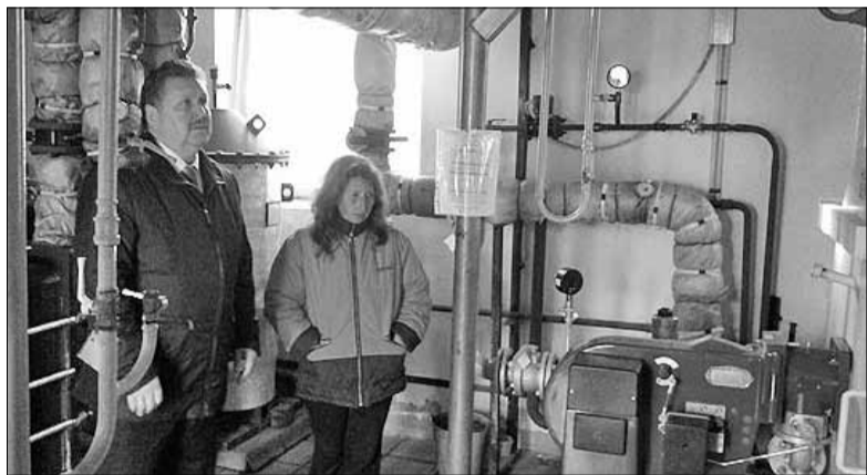
Внутри Козьмодемьянской котельной