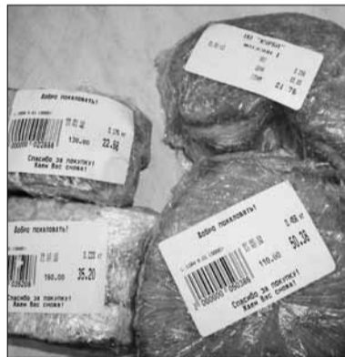
На товарах не указаны срок годности и производитель

производителя нет. Спрашивается, как в этой ситуации ориентироваться покупателям, как узнать, какой свежести продукты?