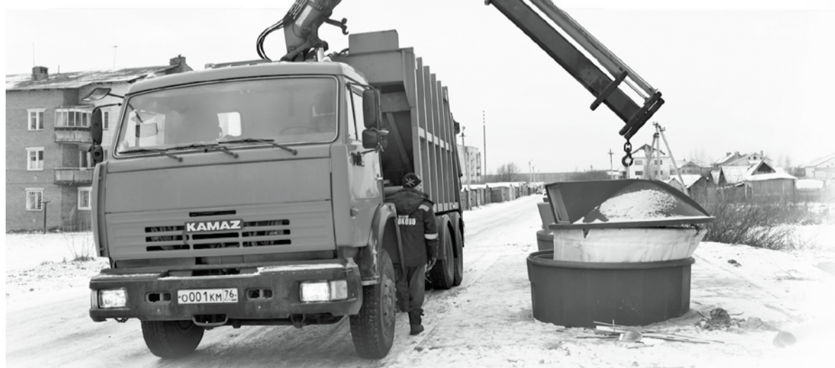
Участвуем в областной программе по внедрению контейнеров заглубленного типа, уже оборудовали 7 площадок в Кузнечихе и одну – в Ярославке.

колодцев, выпиливание деревьев, уборка мусора, ликвидация несанкционированных свалок. У нас создано МУ «Центр развития ОМС», которое возглавляет Ю. С. Кликунас. Участвуем в областной программе по внедрению контейнеров заглубленного типа, уже оборудовали 7 площадок в Кузнечихе и одну – в Ярославке, здесь же планируются еще две. У этих пятикубовых контейнеров есть преимущества: реже и более рационально используется транспорт, меньше затрат. А в дальнейшем планируем перейти на раздельный сбор, когда один