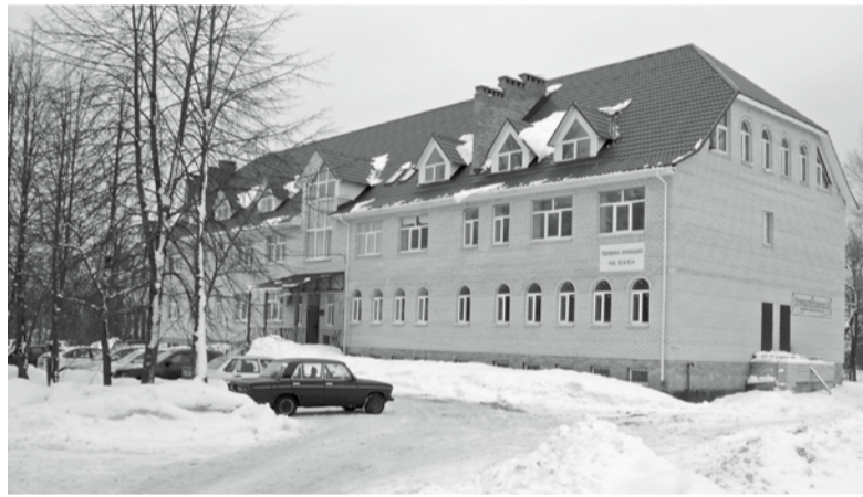
Новое здание, в котором расположена администрация поселения.

План на 2013 год: строительство участков водопровода в Толбухино и Андрониках, колодцев в нескольких деревнях, по программе ОАО ЖКХ «Заволжье» –