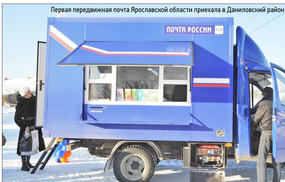
Первая передвижная почта Ярославской области приехала в Даниловский район