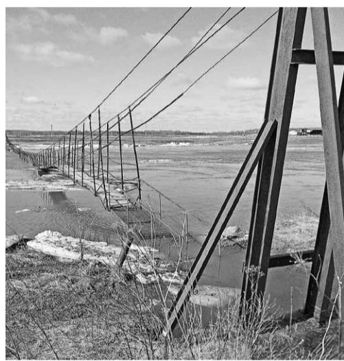
Мост у деревни Осовые будет восстановлен, когда спадет вода в Которосли