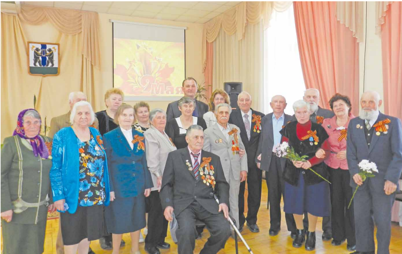
Делегация Карабихского поселения

Время летит быстро. Кажется, еще недавно мы отмечали 60-ю, а затем 65-ю годовщины Великой Победы. И вот уже 68 лет прошло, как мир одержал Победу над фашизмом.