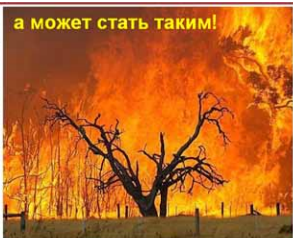
а может стать таким!