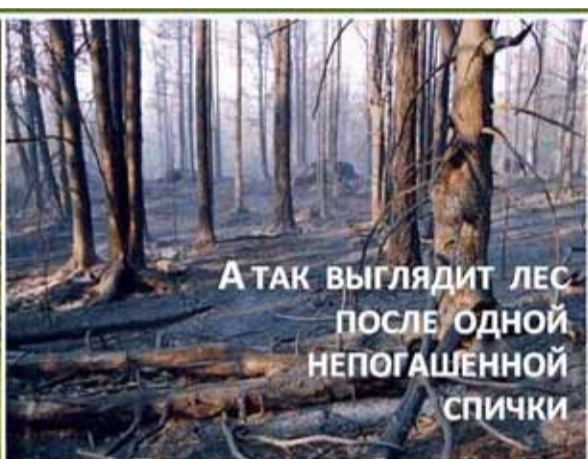
А ТАК ВЫГЛЯДИТ ЛЕС ПОСЛЕ ОДНОЙ НЕПОГАШЕННОЙ СПИЧКИ

СОБЛЮДАЙТЕ ПРАВИЛА ПОЖАРНОЙ БЕЗОПАСНОСТИ В ЛЕСУ