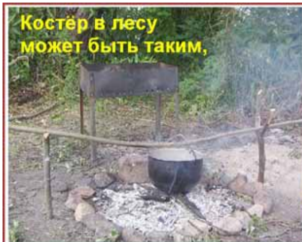
Костёр в лесу может быть таким,

Раскладывать костер нужно подальше от нависающих ветвей, гнилых пней, бревен, сухой травы и скоплений листьев. Всегда