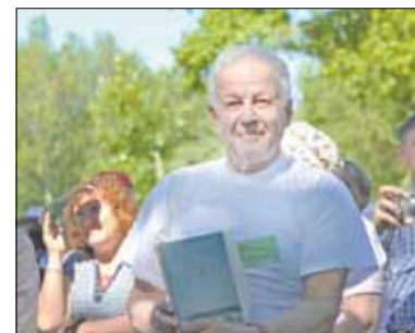
▲ Поэт В.Пonomаренко