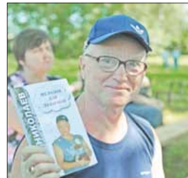
▲ Поэт С.Николаев