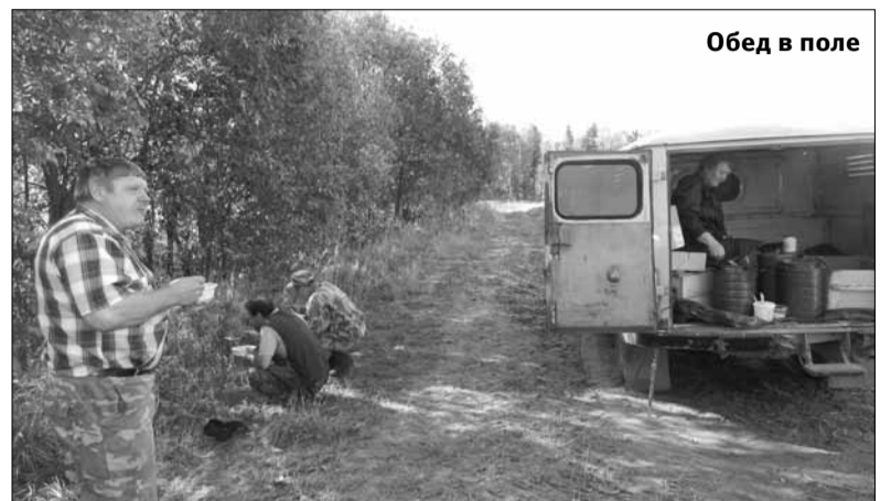
Обед в поле