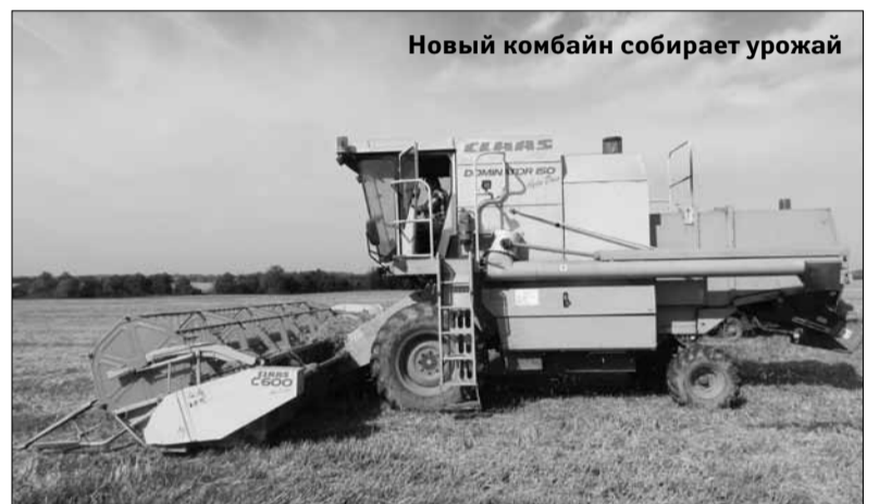
Новый комбайн собирает урожай