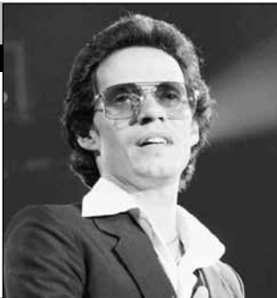
США, 2006, режиссер Леон ИЧАСО

Жизнь обладателя «золотого голоса», популярного исполнителя латиноамериканской сальсы Гектора Лаво началась в знойном Пуэрто-Рико и трагически оборвалась в холодном Нью-Йорке. Она была подобна сальсе — пылкой, быстрой и оригинальной, где стремительный вихрь страсти закручивал знаменитого Гектора Лаво и его верную подругу Нильду Перес в ярком и опасном танце любви.