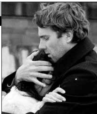
Германия, 2009, режиссер Андреас ШТРУК

Мартин — молодой музыкант с трудным характером. Узнав, что Кристина любит только его талант, он решает порвать с прошлым и в результате оказывается на улице. Среди бездомных он часто видит молодую женщину, которая кажется ему неординарной личностью. Женщина умирает, и в руки Мартина попадают ее дневник и стихи. Смогут ли они привести Мартина назад: к Кристине, его музыке и самому себе?