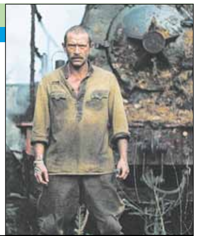
Россия, 2010, режиссер Алексей УЧИТЕЛЬ