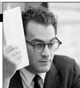
США — Франция — Великобритания, 2009, режиссер Итен КОЭН

Ларри начинает задаваться вопросом о ценности жизни, когда он обнаруживает, что его жена хочет развестись. У него также проблемы с его детьми, ворующими деньги из его кошелька, и его братом-бездельником, который поселился у него, потому что у него нет ни денег, ни зрелости для того, чтобы жить своей собственной жизнью.