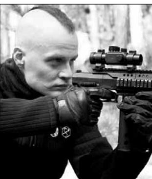
Россия, 2008, режиссер Федор БОНДАРЧУК

2157 год — эпоха расцвета человеческой цивилизации. Пилоты Группы Свободного Поиска бороздят просторы Вселенной. Главный герой, Максим Камеррер, совершает вынужденную посадку на планете Саракш, но уже через несколько минут его корабль будет уничтожен, а герой окажется узником неизвестной планеты. Вскоре Максим сталкивается с человеческой цивилизацией.