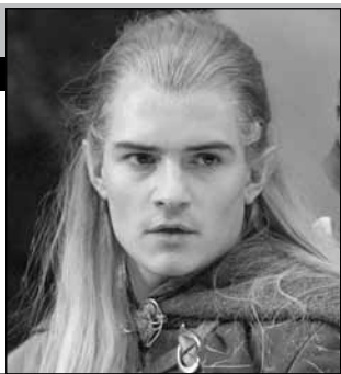
США — Новая Зеландия, 2001, режиссер Питер ДЖЕКСОН