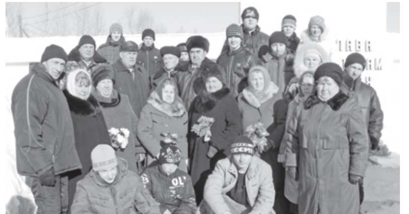
На митинге у памятника погибшим односельчанам в д. Григорьевское.