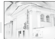
ул. Максимова, 15 тел. 30-92-65

КОНЦЕРТ СИМФОНИЧЕСКОЙ МУЗЫКИ Ярославского академического симфонического оркестра. В программе: увертюры и арии из опер Дж. Россини, вокальный цикл «Летние ночи» Г. Берлиоза