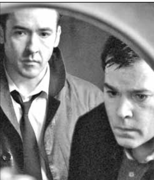
США, 2003, режиссер Жеймс МЭНГОЛД