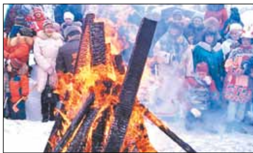
ПРОЩАЙ, МАСЛЕНИЦА, ЗДРАВСТВУЙ, ВЕСНА!