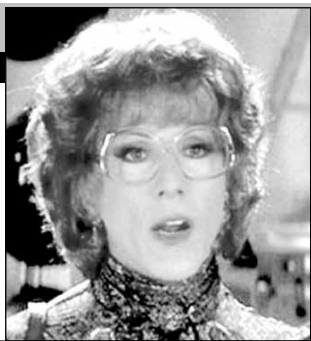
США, 1982, режиссер Сидни ПОЛЛАК

Комедия. Актер Майкл Дорси из-за своего характера не может удержаться ни на одной работе. Тогда он переодевается в женское платье и вскоре понимает, что женщиной он больше нравится людям. Дороти-Майкл сразу получает работу. Однако у него возникают трудности с девушкой, которую любит.