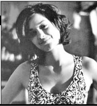
Франция, 1998, Режиссер Жерар ПИРЕС