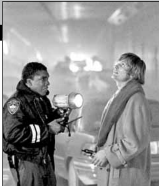
США, 1996, режиссер Роб КЮЭН

Машина таксиста Кита Латуры в момент взрыва оказывается на въезде в огромный подводный тоннель, ведущий в Нью-Джерси. Огромный огненный шар проносится по тоннелю. В живых остается только дюжина испуганных людей. Без посторонней помощи им не выбраться. Кит Латура совершает отчаянную попытку пробраться в тоннель и вывести из него людей.