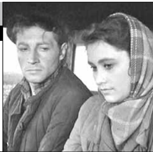
СССР, 1957, режиссер Станислав РОСТОЦКИЙ