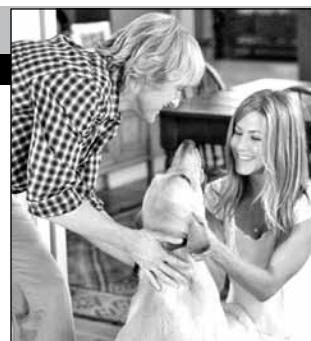
США, 2008, режиссер Дэвид ФРЕНКЕЛ