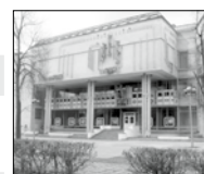
ул. Свободы, 23 тел. 30-86-83