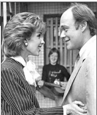
Швеция, СССР, 1989, режиссер Петр ТОДОРОВСКИЙ