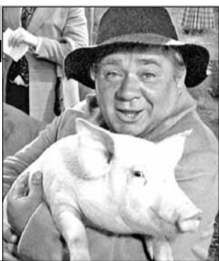
СССР, Финляндия, 1979, режиссер Леонид ГАЙДАЙ

Действие этой комедии происходит в дореволюционной Финляндии в 1910 году, когда эта страна еще была частью Российской империи. Жена посылает Ихалайнена за спичками, а тот по дороге встречает едущего навестить его старого друга, с которым десять лет назад они дали зарок не пить спиртного. Друг ехал к Ихалайнену с просьбой выступить в роли свата - его жена умерла, и пришел срок обзаводиться новой хозяйкой.