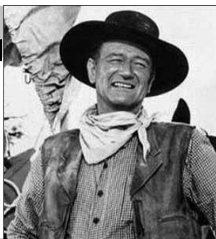
США, 1967, режиссер Берт КЕННЕДИ

Тау Джексон возвращается из тюрьмы на свое ранчо, которое было разорено и ограблено местным воротилой Франком Пирсом. Он заключает сделку с Ломаксом, человеком, который стрелял в него 5 лет назад, чтобы объединить усилия и совместно отомстить Пирсу. Джексон собирается ограбить бронированный фургон, в котором повезут большое количество золота.