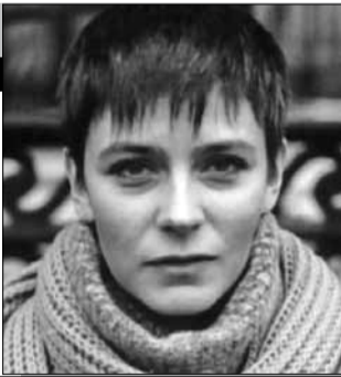
СССР, 1985, режиссер Игорь МАСЛЕННИКОВ

Главная героиня - красивая, интеллигентная 30-летняя Ольга - разведенная, одна воспитывает 5-летнего сына Антошку. Ольга пытается устроить свою семейную личную жизнь и надеется на счастье, которое обретет с любимым. Но 45-летний избранник женат и не решается оставить семью. Редкие, торопливые встречи Ольги с ее возлюбленным оставляют у молодой женщины горький осадок.