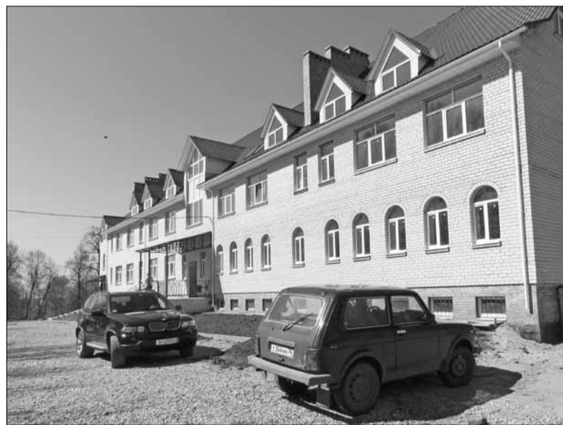
НОВОЕ ЗДАНИЕ АДМИНИСТРАЦИИ

– Самое главное пожелание жителям поселения – это активно участвовать в решении проблем на местном уровне. Местная власть без участия жителей ни одну проблему не в состоянии решить.