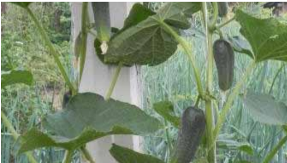
Огурцы – молодцы!

Участвуйте в нашем конкурсе «Фото с огорода», присылайте интересные и необычные снимки с ваших приусадебных участков. По итогам конкурса победителя ждет ценный приз.