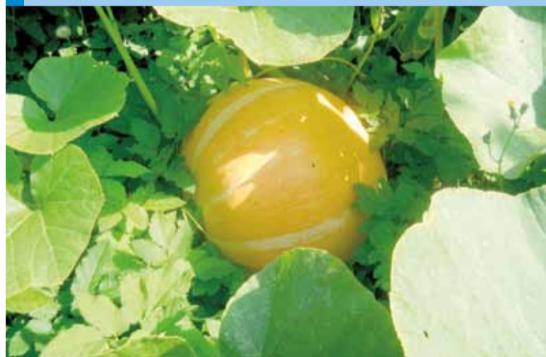
Подарок для Золушки.