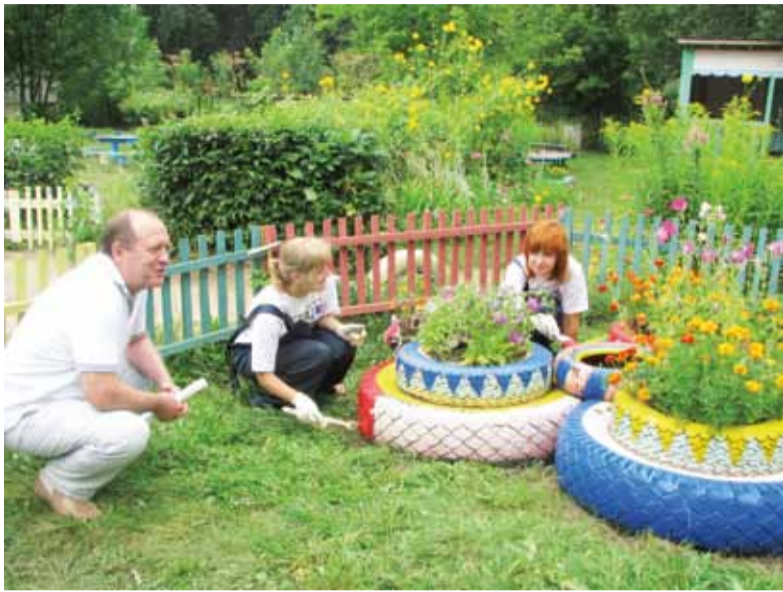
19 августа завершается трудовая смена проекта «Студень» в Ярославском районе.

Проект с успехом проводился в четвертый раз. Как сообщили организаторы проекта – отдел культуры, молодежной политики и спорта администрации ЯМР и МЦ «Содействие», – в этом году «Студни» выполняли работы по благоустройству территории детского сада №16 «Ягодка», после чего малыши смогли играть на ярких и красивых детских площадках. Для детворы п. Ми-