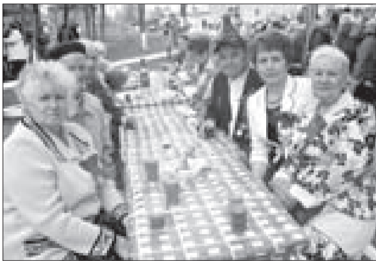
ВЕТЕРАНЫ ТУНОШЕНСКОГО ПОСЕЛЕНИЯ ЗА ЧАЕМ

ского сердца, вера в Победу. Под звуки популярной песни военных лет «Темная ночь» на затемненной сцене появляются сначала артисты в военной форме, затем девушки. В медленном танце двигаются они по сцене, на последних тактах песни артисты встают в пары. Свет на сцене становится чуть ярче. Ребята читают стихи Константина Симонова «Жди меня»: