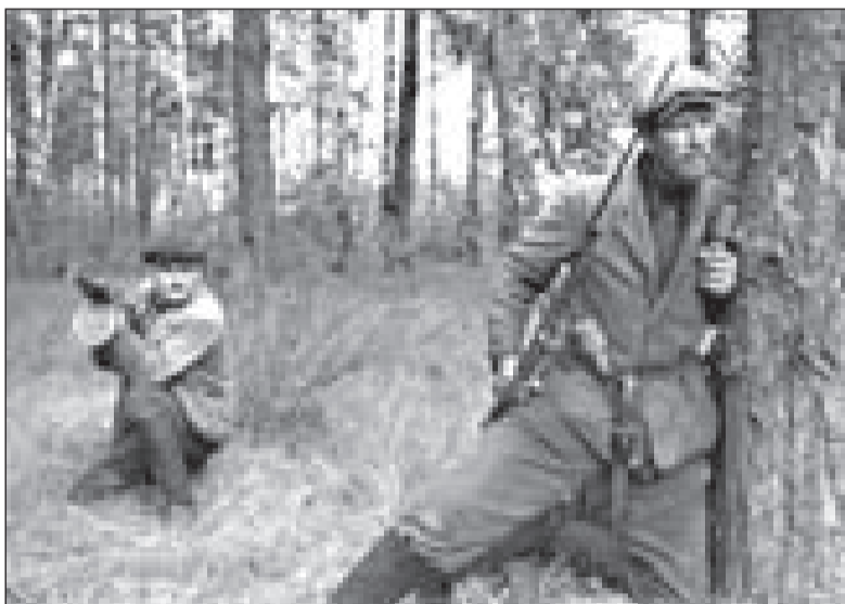
ПАРТИЗАНЫ В ЗАСАДЕ (1942 Г.)