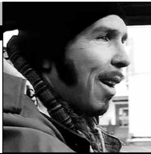
Россия, 1997, режиссер Гарик Сукачев