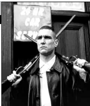
Великобритания, 1998, режиссер Гай Ричи