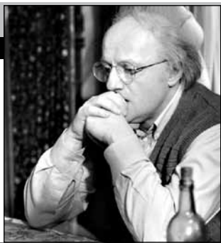
Россия, 2009, режиссер Андрей Хржановский