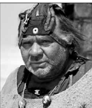
СССР, 1986, режиссер Георгий Данелия