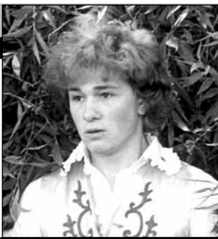
СССР, 1984, режиссер Марк Захаров