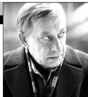
СССР, 1985, режиссер Карен Шахназаров