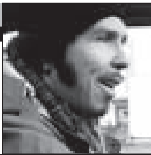
Россия, 1997, режиссер Гарик Сукачев