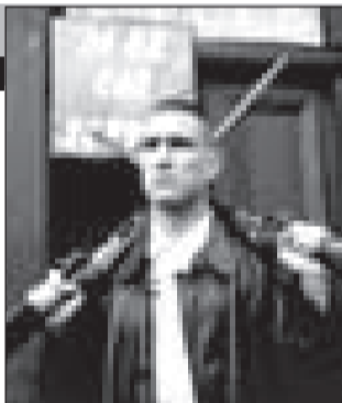
Великобритания, 1998, режиссер Гай Ричи