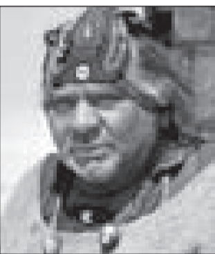
СССР, 1986, режиссер Георгий Данелия