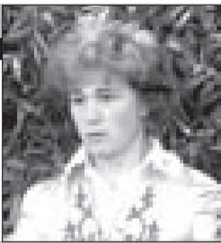
СССР, 1964, режиссер Элем Климов