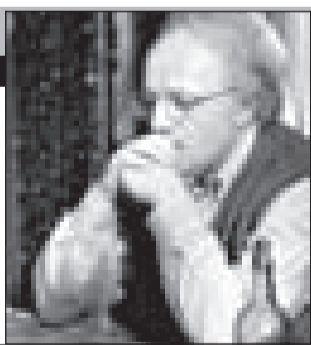
Россия, 2009, режиссер Андрей Хржановский