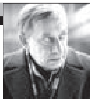
СССР, 1985, режиссер Карен Шахназаров