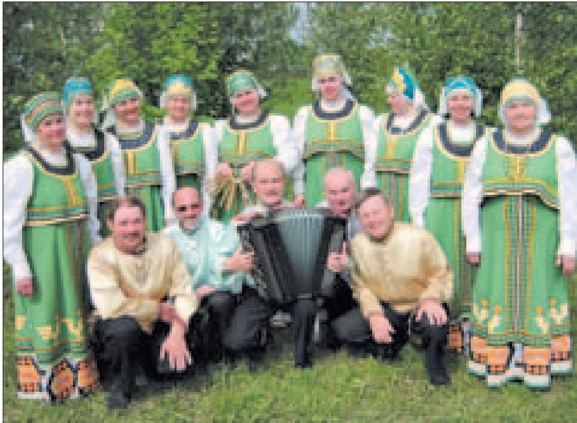
НАРОДНЫЙ АНСАМБЛЬ ПЕСНИ И ТАНЦА «РУССКАЯ ГОРНИЦА» ИЗ ИВНЯКОВ