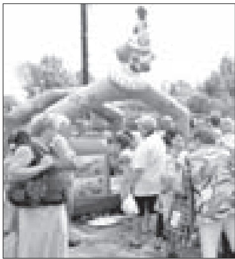
Полоса подготовлена пресс-службой администрации ЯМР

В преддверии праздника все предприятия, осуществляющие деятельность на территории района, смогут принять участие в специализированных конкурсах за звание лучшего. Познакомиться с условиями конкурса и другой информацией, касающейся предстоящего проведения Дня района, можно на сайте администрации ЯМР, с помощью специально созданного баннера «День района-2010».