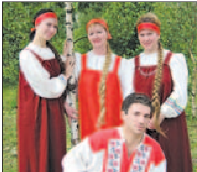
АНСАМБЛЬ «НАДЕЖДА» ГЛЕБОВСКОГО ДК

Красивая, крупная, сильная, умная СОБАКА (девочка одного года), метис восточно-европейской овчарки, ищет надежного хозяина. Отличный друг и великолепный сторож. Хороша как для городской квартиры, так и для загородного дома. Телефоны: 30-74-33 и 8-961-162-31-49.