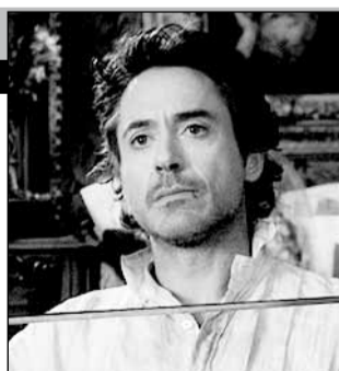
Германия-США, 2009, режиссер Гай РИЧИ