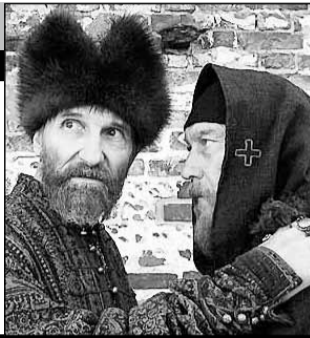
Россия, 2009, режиссер Павел ЛУНГИН