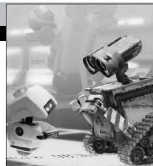
США, 2008, режиссер Эндрю СТЭНТОН

Робот ВАЛЛ-И из года в год прилежно трудится на опустевшей Земле, очищая нашу планету от гор мусора, которые оставили после себя улетающие в космос люди. Он и не представляет, что совсем скоро произойдут невероятные события, благодаря которым он встретит друзей, поднимется к звездам и даже сумеет изменить к лучшему своих бывших хозяев, совсем позабывших родную Землю.