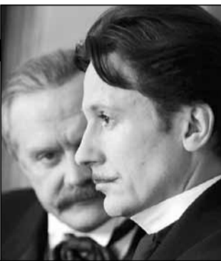
Россия, 2005, режиссер Филипп ЯНКОВСКИЙ

Российская империя, конец XIX века. В министерском вагоне курьерского поезда неизвестным убит бывший командир Отдельного корпуса жандармов генерал-губернатор Храпов, направлявшийся через Москву к месту службы. Из донесения охраны следует, что Храпов был убит статским советником Эрастом Фандориным, в чьи обязанности входило обеспечение безопасности генерал-губернатора.