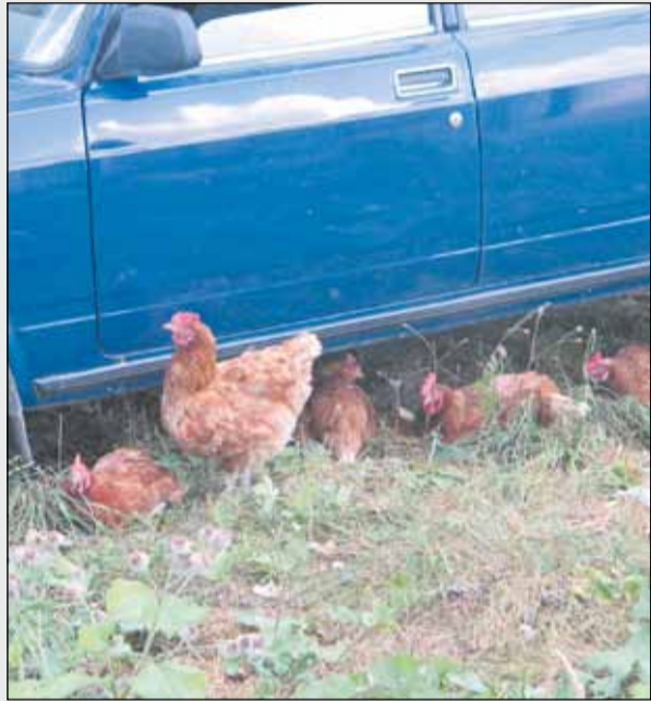
НА ФОТО: ДЕВОЧКИ, НУ ГДЕ ЖЕ ВОДИТЕЛЬ?