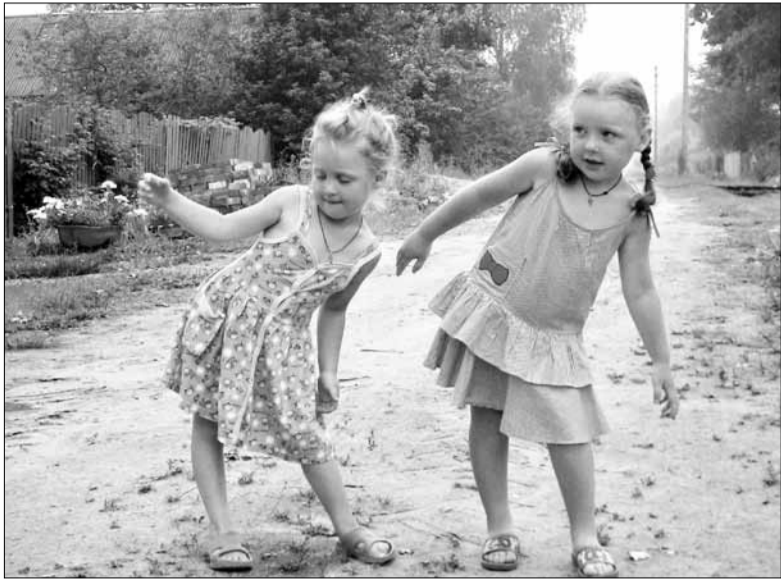
«РАЗ, ДВА, ТРИ! МОРСКАЯ ФИГУРА НА МЕСТЕ ЗАМРИ!» (ФОТО О. В. ДУБИЧЕВА).

Редакция продолжает новый фотоконкурс. Если у вас есть фотокамера и талант замечать необычные моменты, если вы любите фотографировать деревенский пейзаж, своих родственников, животных в их повседневной и не очень жизни – милости просим. Присылайте нам все то, что приглянулось и чем вы хотите