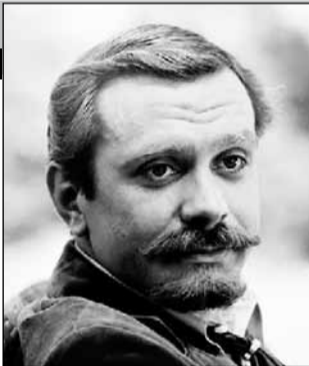
СССР, 1976, режиссер Никита МИХАЛКОВ