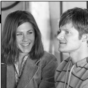
США, 2008, режиссер Стефен БЕЛБЕР