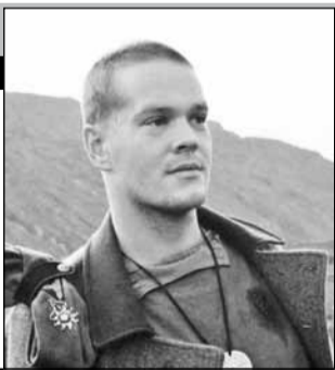
Россия, 2002, режиссер Александр РОГОЖКИН