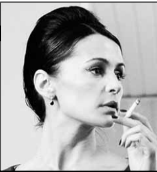
Россия – Украина, 2008, режиссер Андрес ПУУСТУСМАА