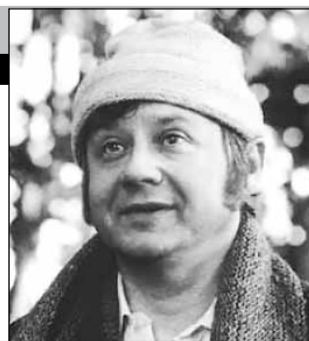
СССР, 1979, режиссер Никита МИХАЛКОВ