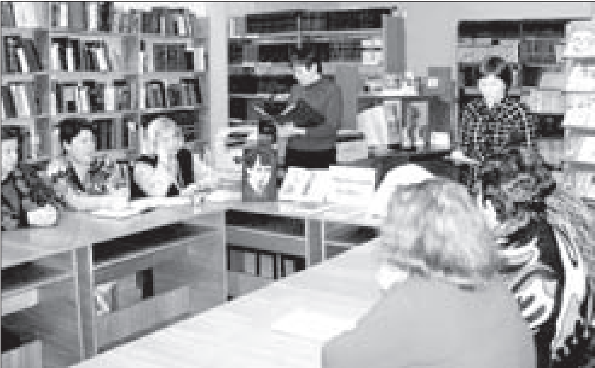
ВETERАНЫ ЗНАКОМЯТСЯ С ТВОРЧЕСТВОМ С.ЕСЕНИНА

Умение наслаждаться каждым моментом, вести активный образ жизни, заниматься общественной деятельностью – все это можно с уверенностью сказать о членах клуба «Радуга жизни». Объединяет этот клуб ветеранов поселка Лесная Поляна, а встречи свои они проводят в центральной библиотеке.