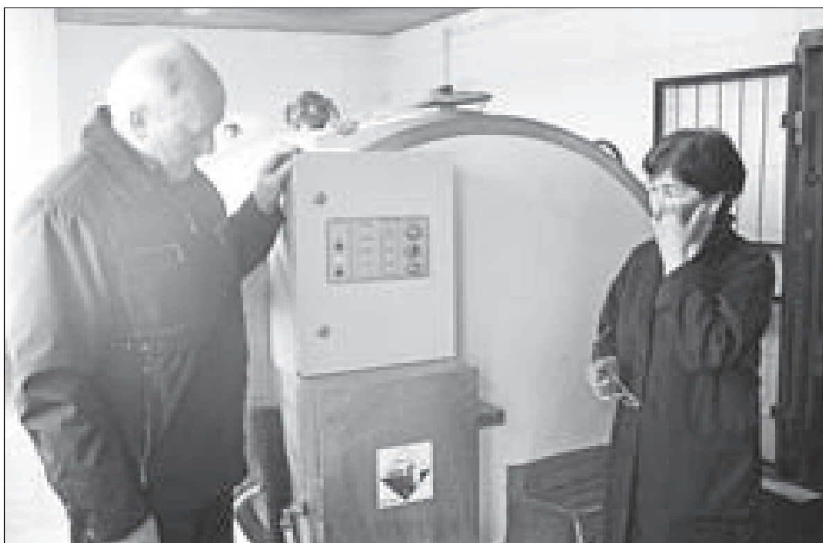
Установки непосредственного охлаждения молока УНОМ(3), сделанные специалистами ЗАО «Производственная компания «Ярославич», экзамен жарой выдержали с честью.

УНОМ(3) изготавливаются по современной технологии с использованием экологически чистых материалов. Установка непосредственного охлаждения молока представляет собой термостатируемую емкость с двустенной оболочкой. Межстенное термоизоляционное пространство оболочки заполнено экологически безвредным высокоплотным пенополиуретаном. Материал внутренней и внешней стенок установки — нержавеющая пищевая сталь с обработкой высокого качества. Выпускаемые ЗАО ПК «Ярославич» охладители молока полностью соответствуют всем требованиям по качеству, предъявляемым российскими и зарубежными стандартами.