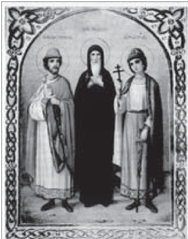
КНЯЗЬ ФЁДОР ЧЕРМНЫЙ С СЫНОВЬЯМИ ДАВИДОМ И КОНСТАНТИНОМ (РЕПРОДУКЦИЯ С ИКОНЫ XIV ВЕКА)