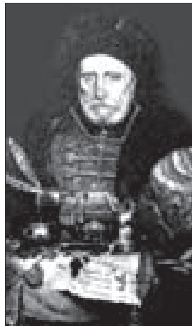
КНЯЗЬ АНДРЕЙ КУРБСКИЙ (ХУДОЖНИК ПАВЕЛ РЫЖЕНКО)

Историческая известность Курбского начинается с 1549 года, когда он на 21-м году жизни, будучи уже в дворовом звании стольника и в чине есаула, принял участие в первом походе Ивана IV на Казань. Именно к этому времени относится первое его упоминание в так называемой «разрядной книге». В 1550 году