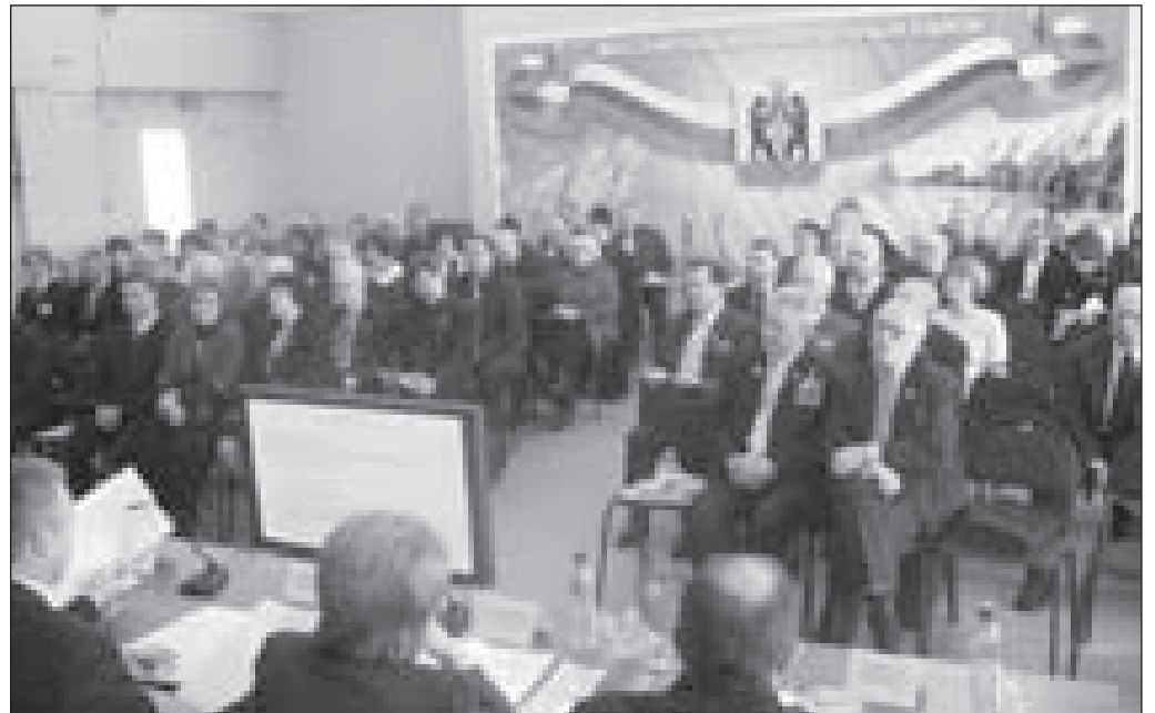
ИДЁТ ЗАСЕДАНИЕ ОБЩЕСТВЕННОЙ ПАЛАТЫ ЯРОСЛАВСКОЙ ОБЛАСТИ

Стратегическая цель развития системы российского образования — обеспечение доступности и улучшение качества образования в Ярославской области, создание условий для повышения доступности образования детей независимо от места их проживания, состояния здоровья