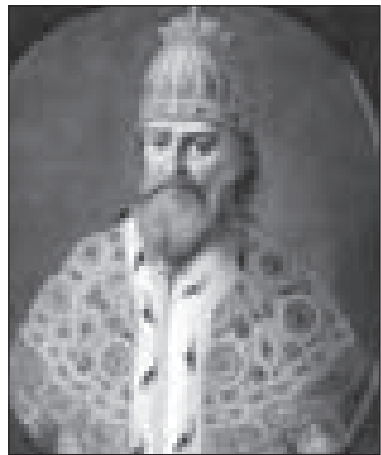
ЦАРЬ ИВАН ГРОЗНЫЙ (КАРТИНА XVIII ВЕКА).

ненавидевшие Елену, отравили её. Детство Ивана было безрадостным, он рос в обстановке боярской вражды и «полном небрежении», в атмосфере дворцовых интриг, породивших в характере будущего царя склонность к подозрительности, лицедейству и садизму. В 1547 году 17-летний Иван венчался на престол, приняв при этом царский титул. Он стал первым русским царём, подчеркнув тем самым, во-первых, значение Русского государства среди других держав, а во-вторых, неограниченность царской власти.